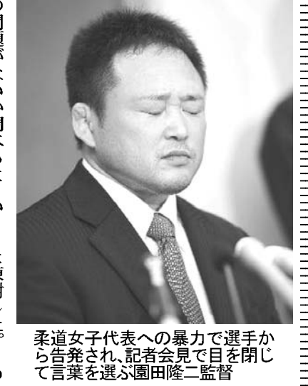
柔道女子代表監督の園田隆雄

全柔連の上村春樹会長は「選手に申し訳ない」と謝罪し、辞意を表明した。全柔連は「選手に申し訳ない」と謝罪し、辞意を表明した。全柔連は「選手に申し訳ない」と謝罪し、辞意を表明した。