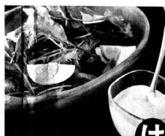
うちなへしーざーサラダ

パイのふたを破ると鮮やかな茶色のポタージュが。一見、手間がかかりそうなおうち外食。冷凍パイシートを使えば意外と簡単。 【材料2人分】 紅イモ100g、タマネギ1/2個、水200ml、豆乳200ml、塩少々、コショウ少々、固形フィッシュ1/2個、サラダ油大さじ1、冷凍パイシート1枚、卵黄少々 【作り方】 ①紅イモは皮をむいて薄くスライスし、水にさらしアクを抜く。タマネギは薄切りにする。 ②鍋にサラダ油を熱してタマネギを炒め、透明になったら紅イモを加え、焦がさないように炒める。 ③紅イモをしっかりと炒めたら水と固形フィッシュを入れ、紅イモが柔らかくなるまで煮て、粗熱がとれたらタマネギにかけ、ピューレにする。 ④③を鍋に戻し、豆乳を伸ばしながら火にかけ、塩・コショウで味を調える。 ⑤カップに④を入れ、冷凍パイシートをかぶせ、表面に卵黄を塗り、190度で余熱したオーブンで10分ほど焼く。