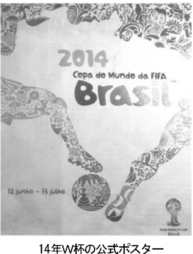
14年W杯の公式ポスター

1月30日、リオで2014年サッカーW杯の公式ポスターが披露された。これは1950年のW杯のポスターに似たデザインが採用された。ポスターは、1950年のW杯のポスターに似たデザインが採用された。ポスターは、1950年のW杯のポスターに似たデザインが採用された。 ポスターは、1950年のW杯のポスターに似たデザインが採用された。ポスターは、1950年のW杯のポスターに似たデザインが採用された。