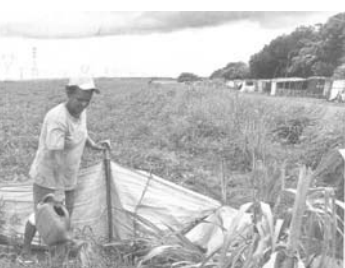
農地面積が町の面積より42%多いテオドール・サンパイオ

全国の農地の登録を担っているIncraのデータがINGRAのデータと一致しない事を指摘したのは全国農業関係者定土組合で、全国では聖州2つ分の土地が、実際の