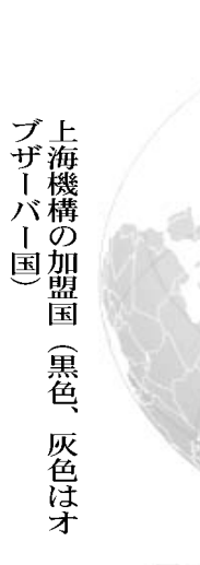
上海機構の加盟国 (黒色) 灰色はオブザーバー国

核実験強行で対抗か。国際社会と攻防、新段階に。核実験で緊張を高め(海外) 安保理が北朝鮮の弾道ミサイル発射を非難した制裁強化決議を採択した。