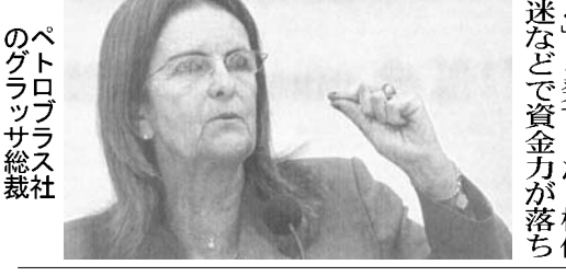
ペトロブラス社のグ拉萨総裁

また、グ拉萨総裁は5日、株主への配当額に差をつけることを発表し、12年の株式配当は