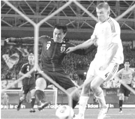
日本-ラトビア=前半、先制ゴールを決める岡崎

「共同」サッカーの国際親善試合、キリン・チャレンジカップは6日、ホームスタジアム神戸で行われ、ことし初戦の日本代表が岡崎(シュツタル)の活躍で、国際サッカー連盟(FIFA)ランキング104位のラトビア代表を3-0で快勝した。