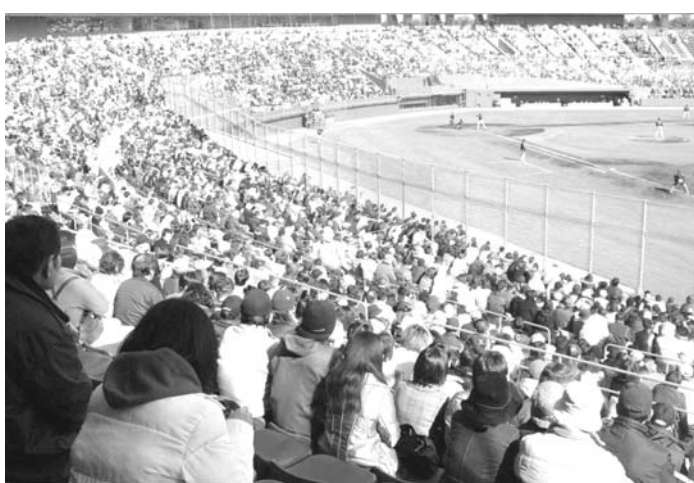
WBC日本代表選手を見ようと球場に詰め掛けた大勢のファン(22/1/2009年サンマリスタジアム宮崎)

確保も難しく、宮崎市内のホテルは満室が続いた。約5000キロ離れた大都会のホテルから通ったファンもいた。