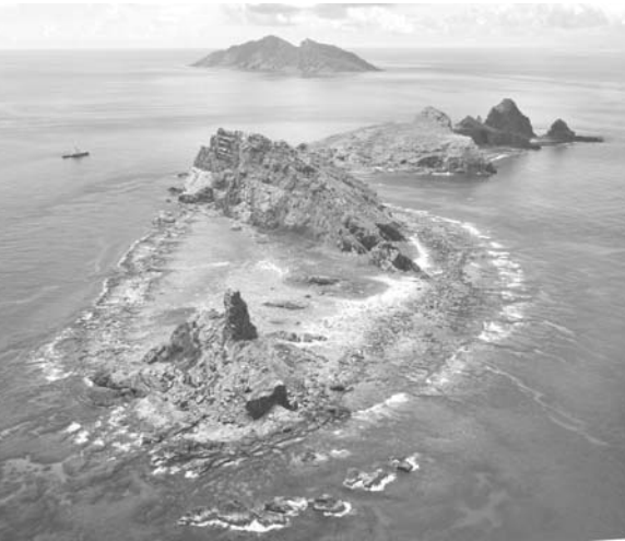
沖縄県・尖閣諸島。手前から南小島、北小島、魚釣島