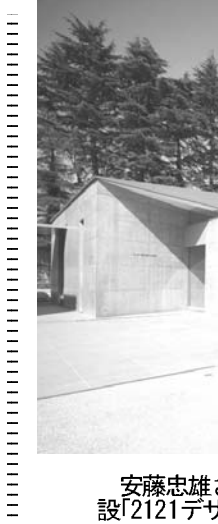
安藤忠雄さんが設計した東京・六本木のデザイン施設「2121デザインサイト」

【共同】在日外国人の外国人登録証を廃止し、新しい身分証に切り替える。日本人と同じ住民票に組み入れる。そんな改正住民基本台帳法などが施行されて半年。外国人に関する戦後最大の制度変更だけに、住民票を扱う自治体現場では混乱