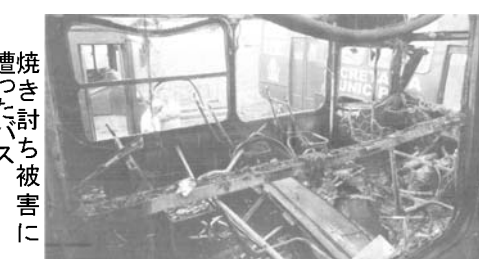
焼き討ち被害に遭ったバス

サンタカタリーナ州では、1月30日以来、バスの焼き討ちや公的機関への火炎瓶投げ込みなどが続き、市民の間で不安や恐怖心が蔓延。14日には、フロリアノポリスとその周辺を走るバスの運転手や車掌達が、バスの運行を7時19時のみとする事を決めた。運転手や車掌達が総会を開いたのは14日午前1時15分から12時半まで停止したほか、フロリアノポリス市とその周辺のバスの運行時間短縮が決議された。