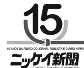
15 ANOS DA FUSÃO DO JORNAL PAULISTA E DIÁRIO NIPPON