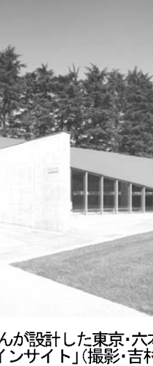
感染予防のため、利用者に手の消毒やうがいをお願いする有料老人ホームの職員

【共同】在日外国人の外国人登録証を廃止し、新しい身分証に切り替える。日本人と同じ住民票に組み入れる。そんな改正住民基本台帳法などが施行されて半年。外国人に関する戦後最大の制度変更だけに、住民票を扱う自治体現場では混乱