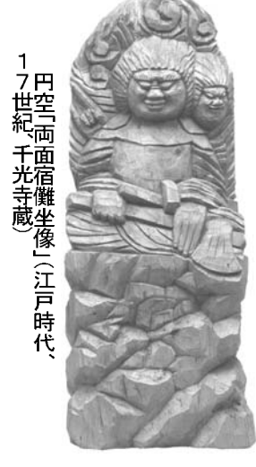
円空「面宿(観音)坐像」(江戸時代、17世紀、千光寺蔵)