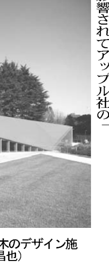
感染予防のため、利用者に手の消毒やうがいをお願いする有料老人ホームの職員

【共同】在日外国人の外国人登録証を廃止し、新しい身分証に切り替える。日本人と同じ住民票に組み入れる。そんな改正住民基本台帳法などが施行されて半年。外国人に関する戦後最大の制度変更だけに、住民票を扱う自治体現場では混乱