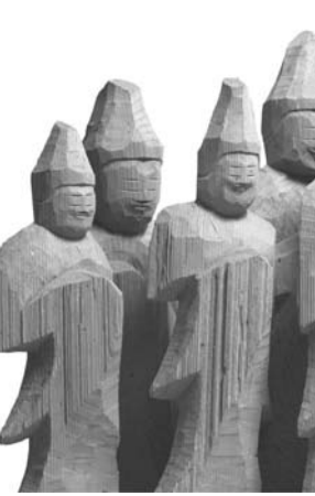
円空「三十三観音立像」(江戸時代、17世紀、千光寺蔵)

その周辺の足跡は、円空の寺として知られる千光寺を中心に、岐阜・高山の寺社が所蔵する作品で構成されている。柔らかな手や足、顔の彫り、多岐にわたる。飛騨の深い森を再現した会場に目を転じれば、林の形も少なくない。これらは木のか、このか。開催中の展覧会「飛騨の円空」千光寺と