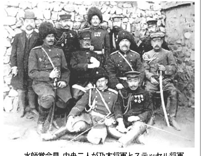
水師營会見 中央二人が乃木将軍とステッセル将軍 (後列左4人目松平英夫)

※これを読めば自然に、日本の文化や歴史に関心ももてるような話を毎週掲載しています。より多くの二世の方や日本語学習者に読んでもらい、少しでも日本に興味を持ってもらえるよう、最寄りの日本語学校や日系団体の掲示板に張ったり、普段は邦字紙を読んでいない兄弟や子や孫などに記事を紹介してください。(ニッケイ新聞編集部)