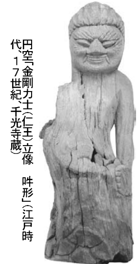
円空「金剛力士(仁王)立像」(江戸時代、17世紀、千光寺蔵)

【共同】入り口に円空自身の像と、いわれる小さな坐像がある。これをなぞると病気が治るといわれる。その簡素な造形、手や足、顔の彫り、多岐にわたる。飛騨の深い森を再現した会場に目を転じれば、林の形も少なくない。これらは木のか、このか。開催中の展覧会「飛騨の円空」千光寺と