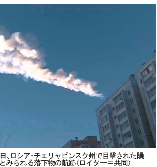
15日、ロシア・チェリヤビンスク州で目撃された隕石とみられる落下物の航跡

ロシアに隕石落下 爆発3回、5000人負傷 【モスクワ共同】ロシア南部ウラル地方のチェリヤビンスク州周辺で15日午前9時20分(日本時間午後0時20分)ごろ、隕石が上空で爆発し、ロシア内務省によると同州の3カ所に破片落下の痕跡が見つかった。人口密集地への落下は免れたが衝撃波で大気が激しく振動、非常事態省によると、割れたガラスの破片による切り傷などで約5000人が手当てを受け112人が入院した。死者はいなかった。隕石落下で多数の負傷者が出るのは極めて珍しい。プーチン大統領はプーチコフ非常事態相に被害の把握と被害者支援を急ぐよう指示した。