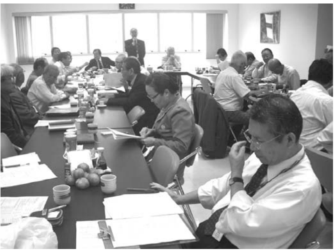
定例役員会の様子

とも3月末には完工予定。今年4月の開所を目指す。今年4月の開所を目指す。今年4月の開所を目指す。今年4月の開所を目指す。