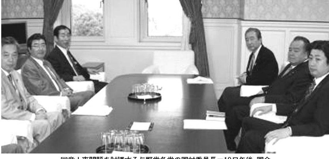
同意人事問題を討議する与野党各党の国対委員長=19日午後、国会

【共同】与野党は19日の国対委員長会議で、国会の同意が必要な政府人事が事前報道された場合には提示を認めないとのルールを撤廃すること合意した。