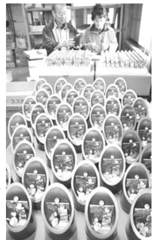
竹筒の中に小さな夫婦びなが並び「かやくびな」

【共同】ゲレンデを訪れた一般女性が笑顔で天気予報のボードに掲げる「雪山ガール」の来場者数は急増。今シーズンは新たに「雪山ガール」も登場した。ゲレンデで天気予報を頼る女性が増え、男性版も登場した。ゲレンデで天気予報を頼る女性が増え、男性版も登場した。ゲレンデで天気予報を頼る女性が増え、男性版も登場した。