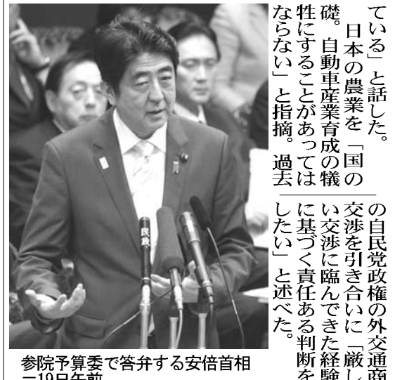
参院予算委で答弁する安倍首相=19日午前

【共同】丹羽宇一郎前駐中国大使が東京都内で19日に講演し、日本と中国が対立する沖縄県・尖閣諸島(中国名・釣魚島)の問題について「日本は早く外交上の係争が認められるべきだ」と述べた。