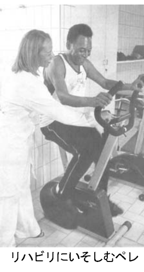
リハビリにいそむペレ