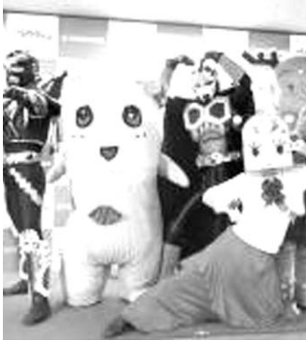
「総選挙」をPRする全国各地のご当地キャラクター

【共同】日本百貨店協会の百貨店を応援する。総選挙は、3月20日から投票を始め、6月まで北海道や東北、中部など全国7地区ごとに代表を1体ずつ選出。8月上旬に東京都内で決勝大会を開き、各地区の代表