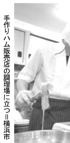
手作りハム販売店の調理場に立つ横浜市

【共同】高卒向け求人が増える。希望して就職先が見つからないまま高校を卒業する若者が少なくない。給料を待たず、働く喜びを実感しながら企業と、お見合いする機会をつくらねばならない。そんな発想からインターンシップ(職業体験)とアルバイトを組み合わせた「バイトン」が始まった。「バイトン」が始まった。専門学校の進みかたが、学費が掛かるので、あきらめた。食材販売会社の面接を受けたが採用に至らず、それきり面接を受けなかった。学校に模索する仕組みだ。実際に働いてみることで向