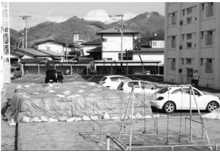
福島市渡利の団地の敷地内に保管されている汚染土

【共同】放射性物質の除染で出た福島の汚染土が片付かない。現場から運び出されて、仮置き場へ中間貯蔵最終処分と国が描く流れのうち、出発点の仮置き場がなかなか確保できないから。東京電力福島第1原発事故から2年。「まずは除染を」と県内各地で作業は進むが、はがした土壌や切り取った木の枝などは袋に詰め込まれ、多くが生活空間で山積みになっている。