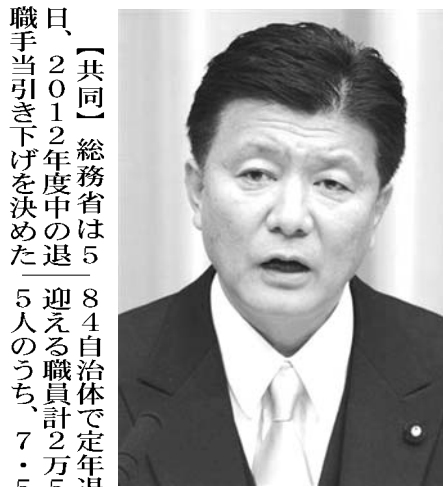
「駆け込み退職」に関して記者会見新藤義孝総務相

【共同】総務省は5日、2012年度中の退職手当引き下げを決めた。5人のうち、7・5%に