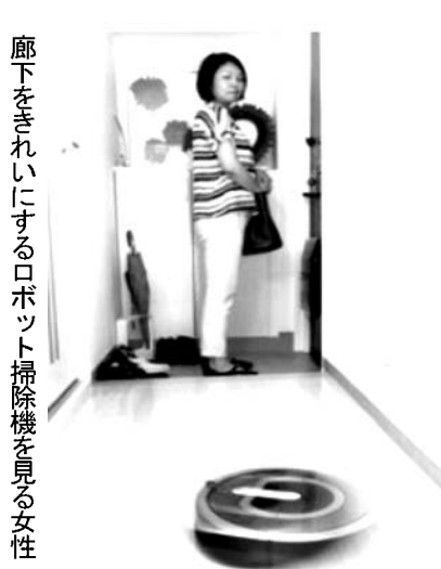
廊下をきれいに掃除するロボット掃除機を見る女性

日本でも10年前から発売された米アイロボット社製の「ルンバ」。東京都内で1人暮らしをする女性会社員(35)は、仕事で帰りが遅くなる時、留守宅の掃除をルンバに頼む。「帰って掃除機をかけるのは周りに気が使う。仕事が忙しくて家事がつかないと感じるときも、掃除を任せることができる」。