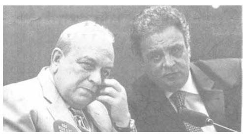
12日ブラジリアでアエシオ氏(右)とセルジオ氏

「FHCのやり方に戻せ」 政党抜きの再国営化訴える 民主社会党(PSDB)から14年の大統領選出馬が有力視されているアエシオ・ネーヴェス氏が12日、「ペトロブラス回復は我々の課題」と題したセミナーで、同社の業績を落としたとして労働者党(PET)政権を批判した。13日付付伯字紙が報じている。