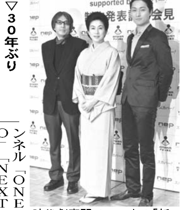
「あいのり2」の出演者ら

【共同】続きはCSで。地上波で人気だった番組の続編やスピンオフ(番外編)が、CS有料チャンネルで次々と制作されている。「まだ見たい」と願う視聴者には朗報となる、この取り組み。放送局側の狙いを探った。