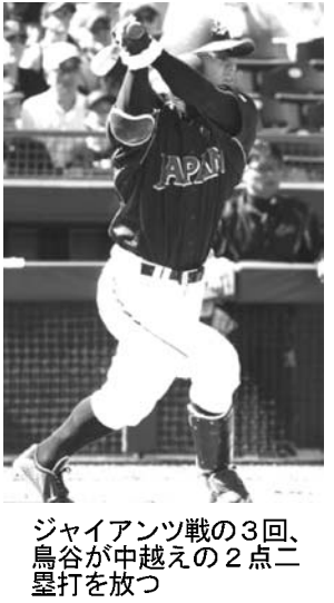
3回、2点、2打、2安打。日本代表は14日、米アリゾナ州スコッツデールで渡米後初の練習試合を行い、昨季の大リーグのワールドシリーズを制したジャイアンツを6-3で下した。

【スコッツデール（米アリゾナ州）共同】野球の第3回ワールド・ベースボール・クラシック（WBC）で3連覇に挑む日本代表は14日、米アリゾナ州スコッツデールで渡米後初の練習試合を行い、昨季の大リーグのワールドシリーズを制したジャイアンツを6-3で下した。