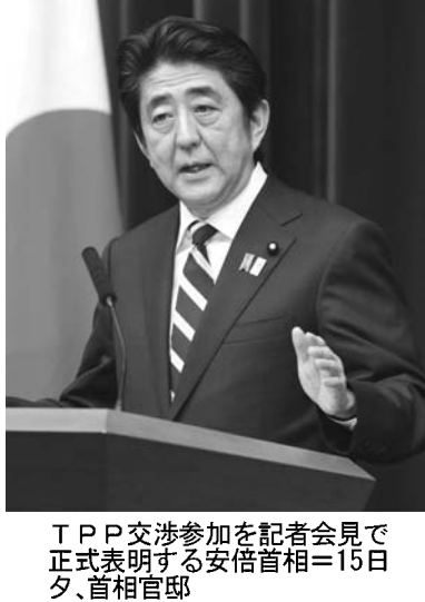
TPP交渉参加を記者会見で表明する安倍首相（15日夕、官邸）

【共同】安倍晋三首相は15日夕、官邸で記者会見し、高いレベルの貿易自由化を目指す環太平洋連携協定（TPP）交渉への参加を正式表明した。