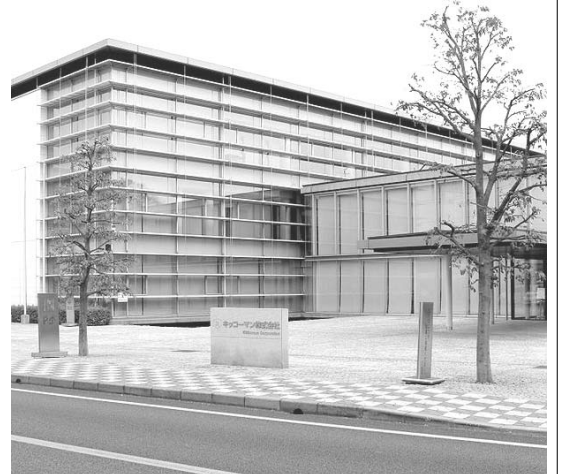
キッコマン野田本社建物

※これを読めば自然に、日本の文化や歴史に関心ももてるような話を毎週掲載しています。より多くの二世の方や日本語学習者に読んでもらい、少しでも日本に興味を持ってもらえるよう、最寄りの日本語学校や日系団体の掲示板に張ったり、普段は邦字紙を読んでいない兄弟や子や孫などに記事を紹介してください。(ニッケイ新聞編集部)