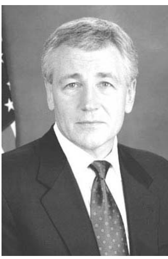
ヘーゲル米国防長官

【シンガポール共同】ヘーゲル米国防長官は1日、シンガポールのアジア安全保障会議で演説した。サイバー攻撃の脅威が高まっていると述べ、二部は中国と中国軍に由来しているように見える」と明言。サイバー空間での国際規範確立に向けて中国と協議していく考えを表明した。