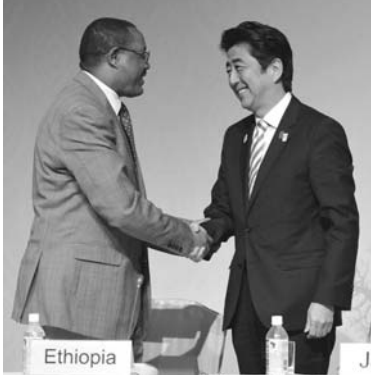
アフリカ連合委員長(左)と安倍首相(右)が握手を交わす。アフリカ開発会議の開幕式で、両者は「アフリカ開発会議」の成功を祈願し、アフリカの発展に貢献することを誓った。

【共同】横浜市で開かれた第5回「アフリカ開発会議」(TICAD)は3日、アフリカの成長の前提条件として「平和と安定」を実現するとともに、民間主導のインフラ整備で成長を促進すると表明した。「横浜宣言」を採択し閉幕した。アフリカ自身の取り組みが一層重視されるとし、農業生産の拡大などに向けた重点施策を示した行動計画もまとめた。日本は今回の会議で、アフリカに投資を呼び込むため民間企業の活用や治安対策の重要性を強調、会議の成果を主要国(G8)首脳会議などの国際会議に生かす方針だ。