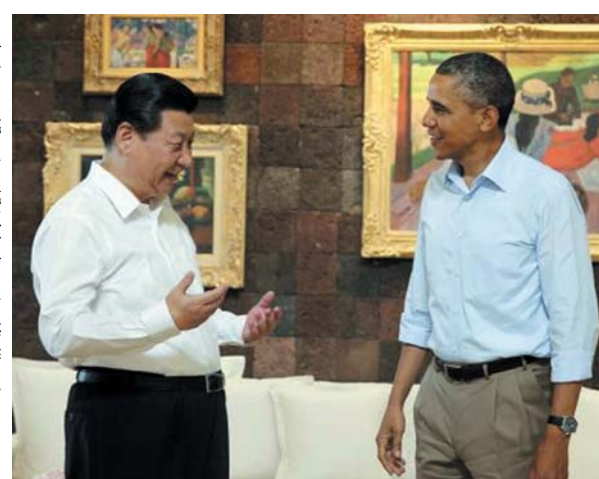
2日目の首脳会談に臨むオバマ大統領（右）と中国の習近平国家主席（左）は8日、米カリフォルニア州バームスプリングズ近郊

【バームスプリングズ共同】オバマ大統領と中国の習近平国家主席は7日（日本時間8日）の夕食会で、日中対立する沖縄県・尖閣諸島問題を協議した。習氏が領有権を主張し日本をけん制したのに対し、オバマ氏は緊張緩和へ自制し、対話解決を図るよう求めた。両首脳は環太平洋連携協定（TPP）の交渉情報も中国側に提供していくことや、北朝鮮を核保有国と認めず非核化を目指すことでも一致した。首脳会談は8日に2日間の日程を終了した。