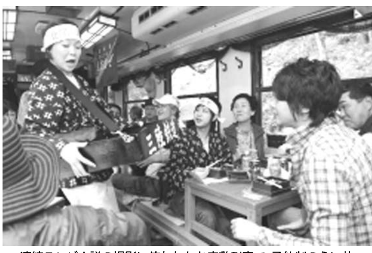
連続テレビ小説の撮影に使われたお座敷列車で、予約制のうに井野川に海女の格好をした