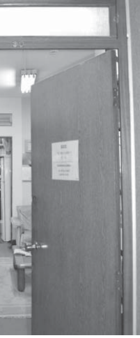
現在の人文研入り口の様子

消防局から指摘されているのは、3階エレベーターの入り口から、フロア最奥に位置する非常出口までの避難通路が確保されていないことだ。その直線上には、人文研事務所兼図書室がある。通路確保のためには、壁を取り壊し、部屋面積を縮小させる必要がある。文協は立ち退きを打診、人文研との間で話し合いが続けられていた。