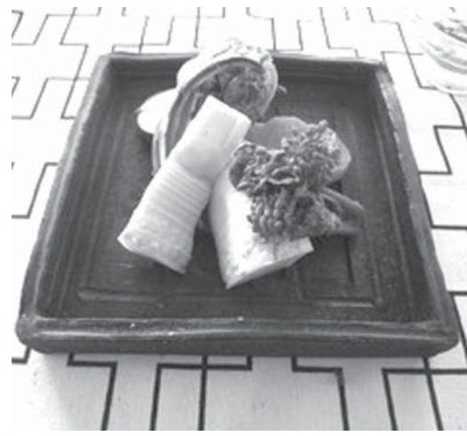
温野菜に和風バーニャカウダ

「さつこはんは、一口含むと、やわらか仕上げ。水分をほどよく含んでいることがわかる。ふんわりしっとり仕上げがされている。」 水分を含む素材をいかに上手に使うか、これが大切なこと。 水分の含有量を見ると、野菜は85%以上、果物が80%から90%、魚は65%から81%、食肉は50%から70%。もちろん鮮度が良いほど、水分量も高くなる。つまりジュシーというわけ。調理の仕方にも工夫がされている。調理法によっては、水分が抜けてしまったり、栄養素が流れてしまったり、あるから。キヤベツなどは、水溶のビタミンCが多い。カットして水に浸すと、カットした断面からビタミンCが水に流れてしまったり、シャキシャキ感があっても、やっぱりそれはもったいない。いかに水分を保持し、