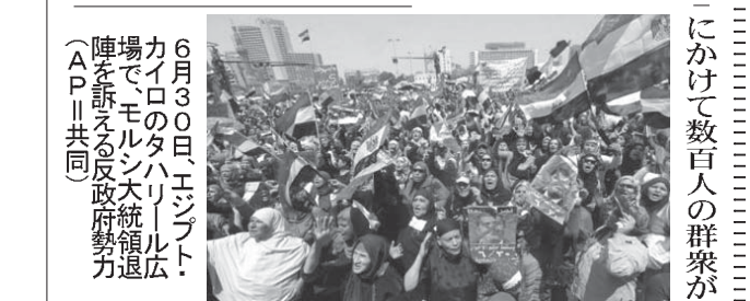
6月30日、エジプト、カイロのタハリール広場でモルシ大統領退陣を訴える反政府勢力

【カイロ共同】エジプトのモルシ大統領の就任1年に合わせた反政府デモは6月30日から7月1日未明まで続き、首都カイロではデモ隊が大統領官邸周辺の道路を埋め尽くして包囲。タハリール広場には約50万人が集結しモルシ氏の退陣を求めた。全土で数百万人がデモに参加したとみられる。参加者が1千人を超えたとの情報もある。デモは民主化運動「アラブの春」で2011年に同国のムバラク政権を倒した革命以来、最大規模となった。反政府勢力は声明で「モルシ氏は正統な大統領でなくなると主張し、2日午後5時（日本時間3日午前0時）までの辞任を要求。受け入れられなければ全国規模のストライキを開始すると警告した。タハリール広場では1日、2日連続となる反政