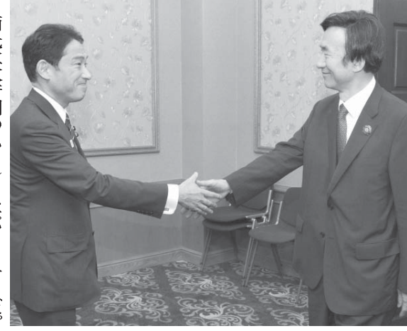
岸田外相（左）と尹氏（右）が握手する。会談は1日午後、バンダルスリブガワン

【バンダルスリブガワン共同】ブルネイを訪問している岸田文雄外相は1日午後（日本時間）同、首都バンダルスリブガワンの国際会議場で、韓国の尹炳世外相と約30分間会談した。両者は島根県・竹島の領有権や歴史認識問題で日韓関係が冷え込んだ現状を踏まえ、関係発展が両国にとって重要な認識を一致。同時に尹氏は「歴史問題は細心の注意を払わないと民族の魂を傷つける」と懸念を示した。日韓外相会談が行われるのは約9カ月ぶり。第2次安倍政権、韓国の朴槿恵政権双方にとって初めて、停滞していた政治対話を再開させ、亀裂修復を図る考えだ。