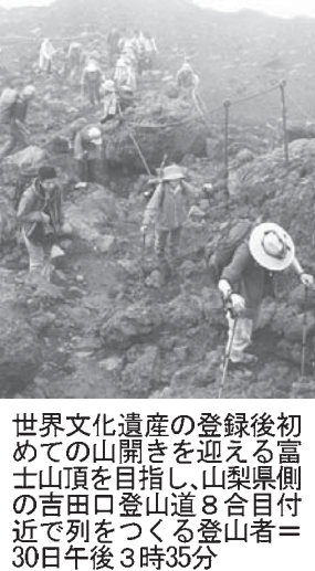
初富側付(左)と後富側付(右)の登山道。30日午前3時35分、富士山頂に「御来光」が出現した。世界文化遺産に登録された富士山(静岡県山梨県)が1日、登録後初の山開きを迎えた。

【共同】世界文化遺産に登録された富士山(静岡県山梨県)が1日、登録後初の山開きを迎えた。全国からの登山者は、ガイドによると例年よりはるかに多く、長蛇の列をつらつらと山頂まで登頂した。雲の間から「御来光」が出現した。