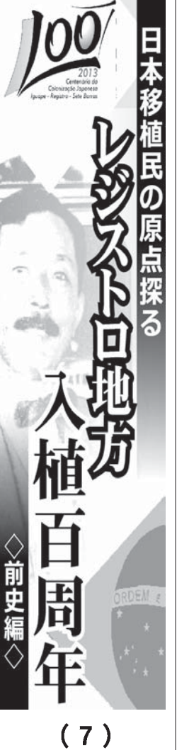
100 2013 100th Anniversary of Immigration