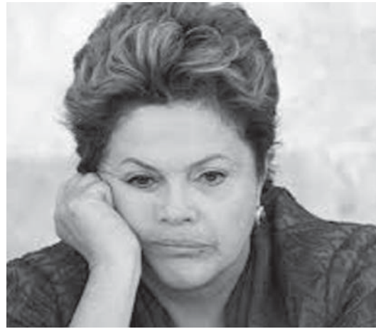
支持率急落を受けたジウマ大統領

も、「よい/最良」が前の57%から30%へ急落し、「普通」が33%から43%、「悪い/最悪」が9%から自己最悪を大きく更新する25%へ急上昇している。2位には前回同様、マリリーナ・シウヴァ氏、続ネットワーク・RS)が続いたが、支持率は前回より7%ポイント増の23%となり、35%ポイントあったジウマ氏との差が一気に7%ポイントに縮まった。この調査の誤差は2%のため、差はほとんどなくなっていると言え、3位のアシオ・ネヴェス氏(民主社会党・PSDB)、4位のエドゥアルド・カンボス氏(ブラジル社会党・PSB)も共に3%ポイント