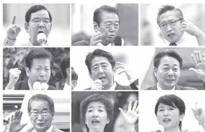
参院選が公示された4日午前、各地で支持を訴える各党党首。右から上から、公明党の山口那津男代表、生活の党の海江田万里代表、民主党の福島県代表、自民党の安倍晋三首相、日本維新の会の石原伸晃代表、共産党の志位和夫委員長、国民の党の宮川正人代表、新進党の山本太郎代表、自由党の山本太郎代表、れいわ新選組の山本太郎代表、国民の党の宮川正人代表、新進党の山本太郎代表、自由党の山本太郎代表、れいわ新選組の山本太郎代表。

【共同】参院選が公示された4日午前、与野党党首らは全国の街頭などで第一声を上げ、17日間の舌戦がスタートした。安倍晋三首相（自民党総裁）は福島市のJR福島駅前前で「東日本大震災からの復興加速に大きな責任がある。復興のためにも強い経済を取り戻し、デフレから脱却させる」と決意を語った。民主党の海江田万里代表は盛岡市内で「自民党が大勝すれば、皆さ