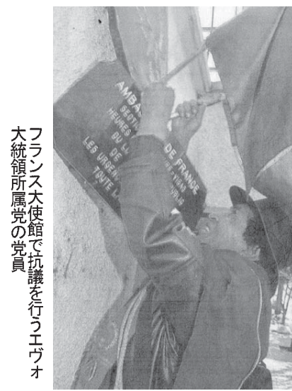
フランス大使館で抗議を行うエヴォ大統領所属の乗客

ポリアビアのエヴォ・モラレス大統領の乗った大統領専用機が、フランスやポルトガルなどの領空を通過拒否によりオーストリアに緊急着陸させられた。オーストリア政府は、この飛行機に搭乗していた米国情報局員(CIA)が個人情報を収集していることを暴露した。オーストリア政府は、この飛行機に搭乗していた米国情報局員(CIA)が個人情報を収集していることを暴露した。オーストリア政府は、この飛行機に搭乗していた米国情報局員(CIA)が個人情報を収集していることを暴露した。