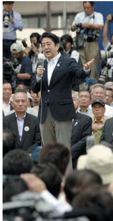
参院選がスタートし、福島市で第一声を上げる安倍首相＝4日午前

【共同】昨年12月の第2次安倍内閣発足後、初の大型国政選挙となる第23回参院選が4日午前、公示された。21日投票に向け選挙区271人、比例代表162人の計433人が立候補を届け出た。衆議院の多数派が異なる「ねじれ国会」が継続するが最大の焦点だ。安倍首相(自民党総裁)の経済政策「アベノミクス」や憲法改正の是非を論議のテーマに、与野党が非改選を含めた過半数を懸けて対決する。与党が勝利すれば、衆院での圧倒的な勢力と合わせて首相の権基盤は強化されるだけに、野党は参院の多数を維持したいと考えた。