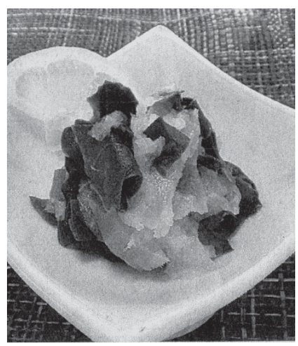
雲南百薬のみぞれあえ