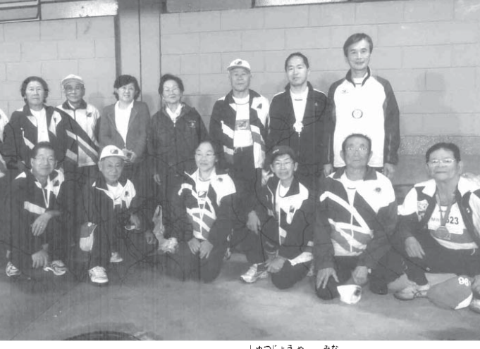
イピラプエラクラブの出場者の皆さん

ANA SP(サンパウロ日系ベテランノ陸上協会)主催の「全伯ベテランノ陸上大会」が先月1、2の両日に開かれ、多くの種目で日本人が活躍した。 仲間各地の82クラブから633人が参加し男女それぞれ30~90歳までの13カテゴリーに分かれ、各種競技に取組んだ。