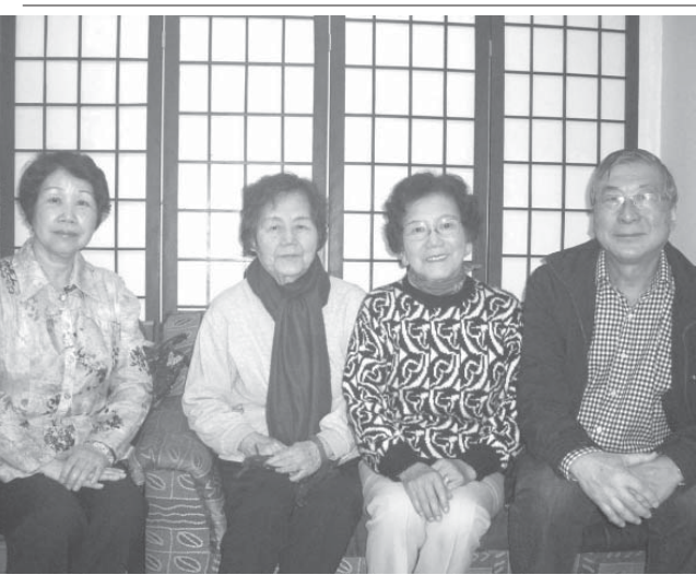
投稿を呼びかけるブラジル日本文学の皆さん

「日本祭り文化コーナー」で俳句、短歌、ハイクイのコンクールを実施する。兼題は、▽俳句「日本(即興的に目に触れたもの)を詠むこと」、冬季祭、郷土祭、自由で2首▽ハイクイ「Festival in Juazeiro, Foz de Iguaçu, Foz de Iguazu」15歳以下は児童部門、16歳以上は成人部門となる。原稿用紙、またはそれに準ずるもの(マス目のある用紙)を使用し、作品の漢字にはふりがなをつけ、電話番号、氏名、住所を明記すること。