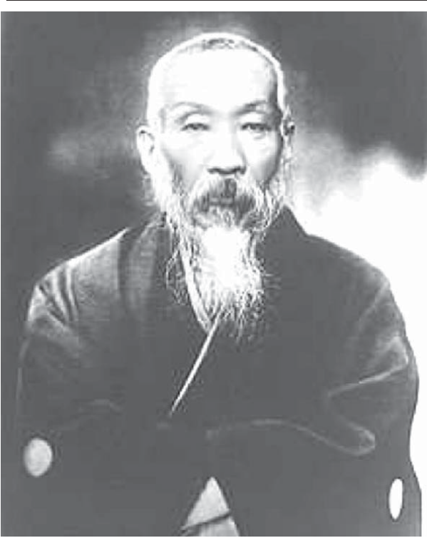
昭和天皇に帝王学として倫理を講じた杉浦重剛

青年期には英国に留学し農学校等に学び、1880年に帰国後、読売・朝日新聞の社説を担当し、三宅雪嶺や志賀重昂らと「聖州新報」を1921年に創刊した。この思想風潮は広く移民に共感されていったに違いない。杉浦は東亜同文書院長を経て、1914(大正3)年には東京高等師範所(現・筑波大学)の御用掛となり、昭和三十二年(1961)に帝立大学として倫理を講じた人物だ。東亜同文書院長時代に東京シンジケートに関係した。ちなみに杉浦重剛が院長を務めた東亜同文書院はブラジル移民との接点が多岐にわたる。1901年(明治34年)に東亜同文会(近衛篤磨会長)によって上海に設立された高等教育機関で、日本が海外に設立した学校の中で最も古いものの一つだ。