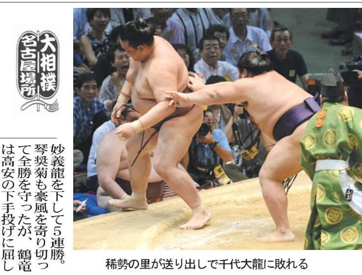
稀勢の里が送り出して千代大龍に敗れる

大相撲名古屋場所 【共同】大相撲名古屋場所5日目（11日・愛知県体育館）大関稀勢の里は平幕千代大龍に送り出されて3勝2敗となり、場所後の横綱昇進は極めて厳しくなった。横綱白鵬は臥牙丸をすくい投げで退け5連勝。横綱日馬富士は小結時天空を突き倒して4勝目を挙げた。大関陣は琴欧州が関脇