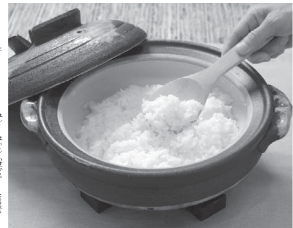
土鍋で炊きあがったご飯

いつも食べているご飯も、基本をつかんでおけば一層おいしくいただけます。炊飯器の選び方と方々の炊き方のコツを聞いた。 I日式の高級機種からマイコン式まで、多様化している炊飯器。ヤマダ電機LABI1日本総本店が、