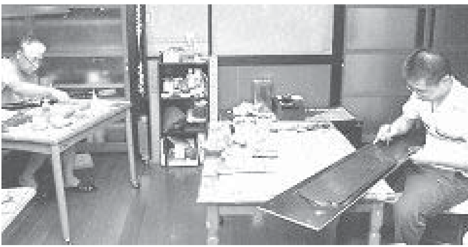
工房で仕事に取り組む蒔絵師。金箔価格の高騰の影響が広がっている＝金沢市末町

【共同】400年以上の歴史を持ち、全国シェアをほぼ独占する金沢市の金箔製造業が、職人の高齢化と後継者不足で厳しい状況にある。需要減に金箔価格の高騰が追い打ちを掛ける。そこで、口伝えだった技術を記録したり、作業に障害者の力を借りたりと、技術伝承に向けて職人らが立ち上がった。