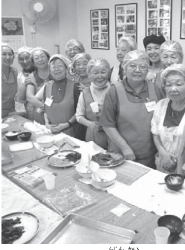
婦人会のみなさん

聖母婦人会は恒例の第55回慈善バザーを7日、聖市のサンゴサール教会で開催し、1500人近くが押し寄せた。来場者らは同会自慢の手打ちうどんや五目混ぜご飯、太巻きなどに舌鼓をうち、名物の福神漬けをうち、名物の福神漬け