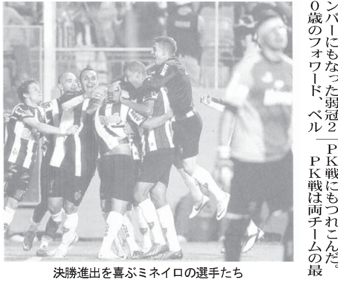
決勝進出を喜びミネイロの選手たち

サッカーのリベルタドーレス杯の準決勝第2試合が10日に行われ、アトレチコ・ミネイロがニューウェルズ・オールドボーイズ(アルゼンチン)を破り、初の決勝進出を決めた。敵地アルゼンチンでの第1試合を0-2で落とすに苦しんでいたミネイロは、本拠地のミナス州ベロ・オリゾンテのインデペンデンスに舞台を移して第2試合を戦った。試合開始早々の前半3分、コンフェデ杯優勝メンバーにもなった弱冠20歳のフオワード、ベル