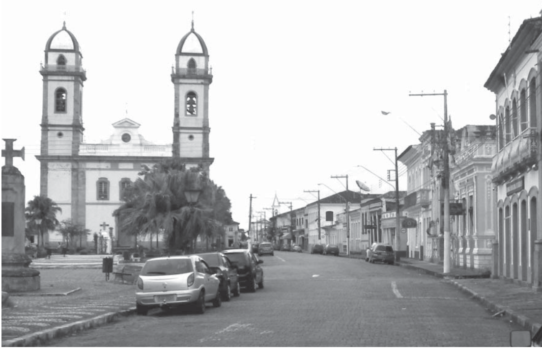
ノッサ・セニョーラ・ダス・ネーベス教会(左)の前の広場にある博物館(右、Museu Municipal de Iguape)

戦勝派が、戦争は日本が勝ったと思いつく。戦勝派が、戦争は日本が勝ったと思いつく。