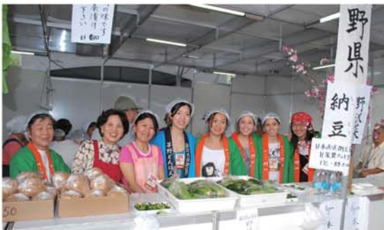
野沢菜漬を販売する長野県人会の皆さん