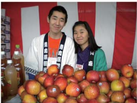
青森県人会は今年もりんごを販売