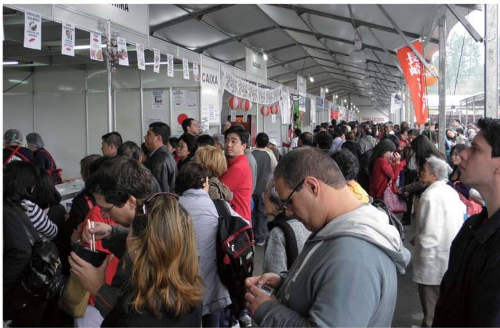
混雑するバンカ前の様子