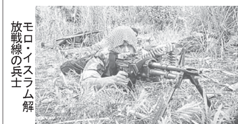
モロ・イスラム解放戦線の兵士

3月までに結論を出すという平和交渉は、紛争激化で何度も中断。昨年10月力により、イスラム勢力による新自治政府を2016年に設立するとの枠組み合意に達した。それだけに、MILF幹部には「この機会を逃したくない」との強い思いがある。