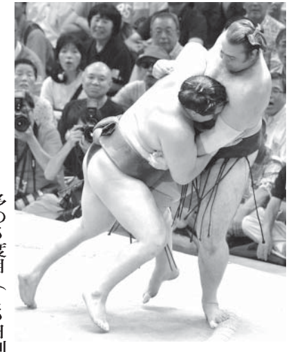
白鵬(左)が寄り切りで琴歐洲を下す

外国出身力士で最多 稀勢、日馬破り10勝目 長問題に絡む解雇処分が取り消され、2年半ぶりに復帰した蒼国来は負け越した。十両は新十両の遠藤が初優勝を決めた。幕内から序ノ口までの優勝が13日目に全て決まった。日本相撲協会によると、15日制定着以降で初めて。