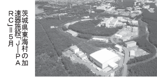
茨城県東海村の加速器施設J-PARC

謎の多いニュートリノの性質を明らかにする成果。ニュートリノは宇宙の進化に影響したと考えられており、変身のしやすさなどのデータが、宇宙の成り立ちを解明する手掛かりになるといわれている。チームはJ-PARCで人工的にミュー型のニュートリノを作り、スーパーカミオカンデに向けて発射。2010年から実験を始め、東日本大震災で1年以上中断したが、再開してデータを積み上げた。