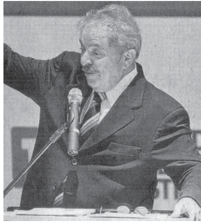
ABC地区の大学で講演中のルーラ前大統領

を、PT内の「Vota Lula」(ルーラよ、戻れ)の声を高まりを納得させる。現時点ではルーラ前大統領の方が優位である事は、候補名を伏せて「大統領選では誰に投票するか」と訊いた時、出馬が予想される候補名を挙げて訊いた時の双方で、ルーラ氏への票が多かった事が証明された。