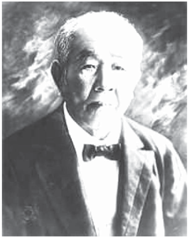
渋沢栄一

「契約を締結して、日本在住者はあとは容易だと思われしれど、実際はこれらが大変だ。青柳氏はこまめに一年半を費やしたが、その間にも政治状況は移り変わり、いろいろ不利な関係から運動も起き、契約調印するまでには惨憺たる苦心を費やした。折角契約したからには、なんとしても苦勞が報われるように日本政府の當局者はしっかりと支援すべきだ」といふ、経歴者ならでは忠告と激励の言葉を贈って援護射撃ともいえる