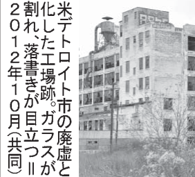
米デトロイト市の破産と化した工場跡ガラスが割れ、落書きが目立つ

【ニューヨーク共同】米自動車大手ゼネラル・モーターズ(GM)が本社を構える「自動車の街」として知られる米デトロイト市(ミシガン州)が18日、連邦破産法9条の適用を裁判所に申請し、財政破綻した。同市によると負債総額は180億ドル(約1兆8千億円)以上で、米自治体の破綻としては過去最大。米経済はリーマン・ショック後の景気後退を脱し、主要産業には活気が戻りつつある。だが米