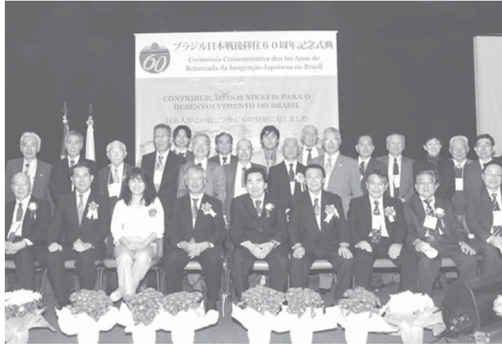
主催者と表彰されたみなさん

1953年、日本人移住が再開されてから今年で60年目を迎え、ブラジル都道府県人会連合会主催の「第16回日本祭り」が開幕した19日午前、会場の聖市イミグランテス会場にあるホールで、「ブラジル日本 戦後移住60周年祭」が開かれた。主役の戦後移住者を中心に、日系団体や当地の日本政府関連機関、日系企業などの代表者が500人集まり、節目の式典を祝った。