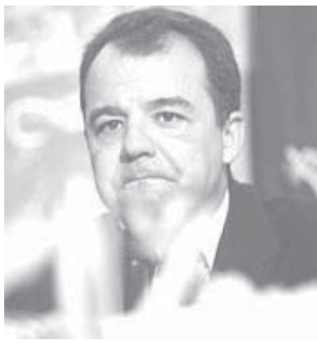
政権評価が最低に終わったリオのカブラル知事

今回の調査はIbopeの依頼で行ったもので、全国工業連合(CNI)で7月9〜12日にアマパ州を除く全国434市、2002人を対象に行われた。現知事政権の評価対象となったのは、聖州、リオ、ミナス、ジェライス、南大河、パラナ、ペルナンブーコ、バイア、サンタカタリーナ、セアラ、ゴイアス、エスピリトサントの11州だ。