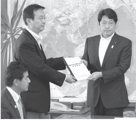
防衛大臣の記者会見の様子

【共同】防衛省は26日、長期的な防衛力整備の指針「新防衛計画の大綱」に関する中間報告を公表し、北朝鮮の核・弾道ミサイル開発を踏まえ「抑止力の強化をあらためて検討し、総合的な対応能力を充実させる」と明記した。