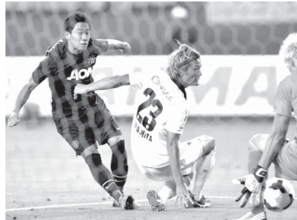
C大阪-マンチェスターU=後半、同点ゴールを決めるマンチェスターU・香川

【共同】浦和はアーセナルに敗れる。マンU香川、大阪で凱旋ゴール。浦和はアーセナルに敗れる。