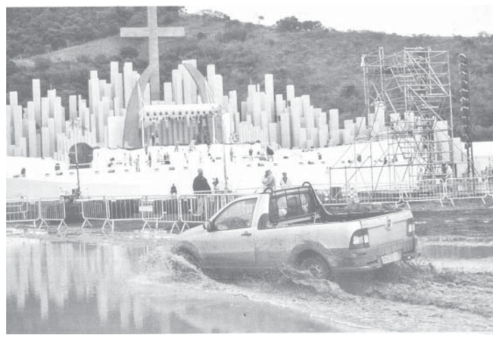
150万人を集めてのミサが予定されていたものの中止となった会場

このイベントには、150万人の信者の巡礼が予想されていた。130万平方メートルのバス会社オナーナから寄