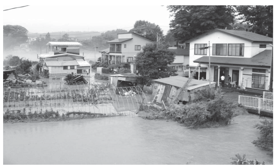
大雨で冠水した秋田県大館市内の住宅地=9日午前、秋田県大館市

【共同】東北と北海道は9日、大気の状態が不安定になって猛烈な雨が降り、秋田、岩手両県で住宅の浸水や土砂崩れが相次いだ。