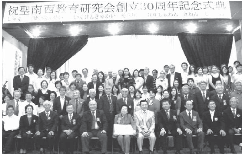
教師や文協役員のみなさん

「ただの式典で終わらせるのではなく、下降気味の日本語教育の再活性化のスタートとなるよう、文協役員、父母会の皆さん、私も教師共々、気を引き締めていきたいと思います。」