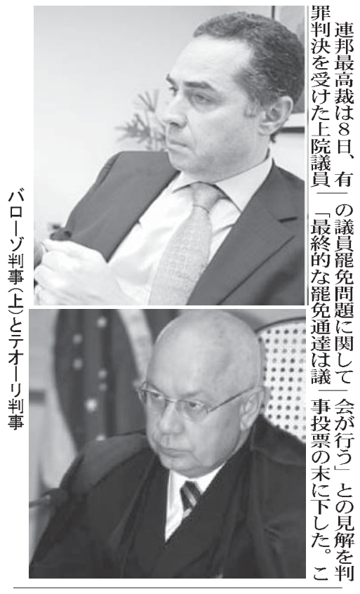
連邦最高裁は8日、有罪判決を受けた上院議員「最終的な罷免通達は議会のみに」との見解を表明した。この見解は、メンサロンと異なる解釈を行う新判事2人の加入が影響を及ぼす。

最高裁は8日、有罪判決を受けた上院議員「最終的な罷免通達は議会のみに」との見解を表明した。この見解は、メンサロンと異なる解釈を行う新判事2人の加入が影響を及ぼす。 最高裁は8日、有罪判決を受けた上院議員「最終的な罷免通達は議会のみに」との見解を表明した。この見解は、メンサロンと異なる解釈を行う新判事2人の加入が影響を及ぼす。