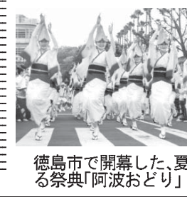
徳島市で開幕した、夏を彩る祭典「阿波おどり」