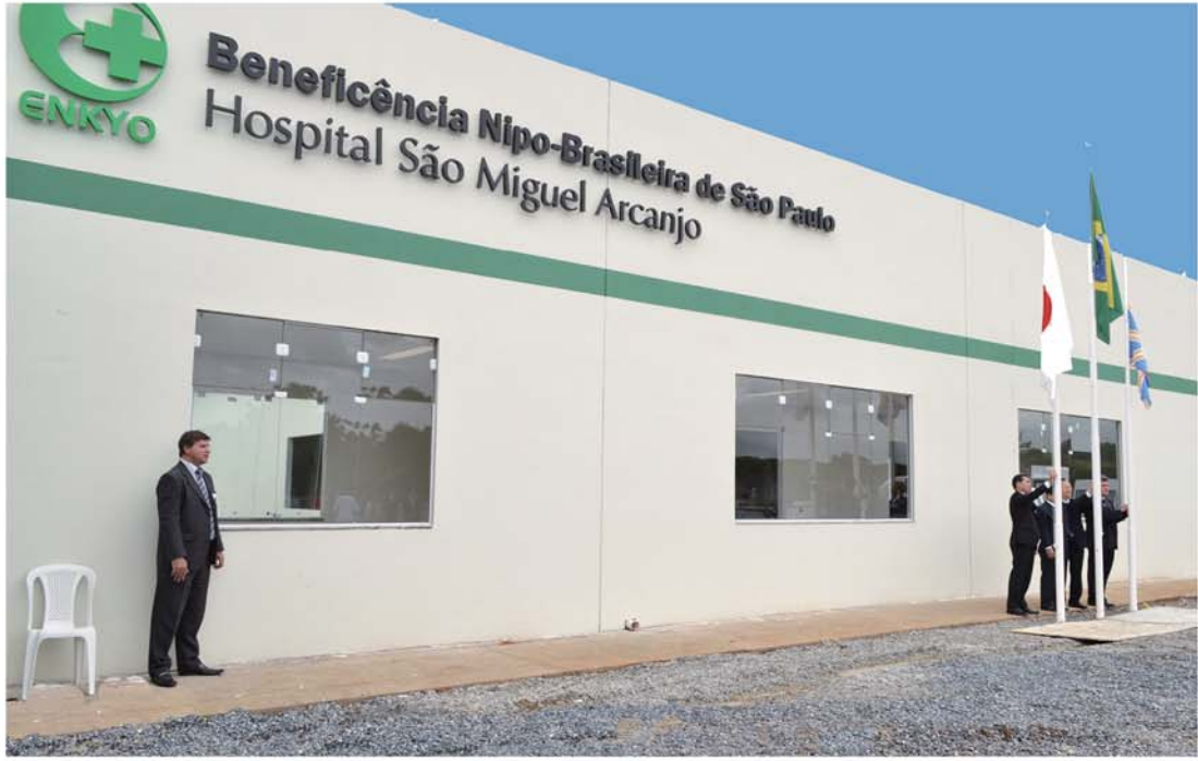
サンミゲル・アルカンジョ病院の外観