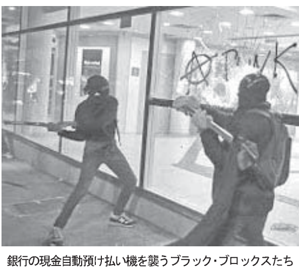
銀行の現金自動預け払い機を襲うブラック・ブロックスたち

行い、セー広場で解散。これを待ち受け、ブラック・ブロックスの一団が一部のパト参加者をいざなう。市議会議事堂に向かい、その一部は市議院内にも乱入した。また、市議会議事堂の前では少なくとも四つの爆弾を撒き散らした。ブラック・ブロックスの一団はその後、軍警との衝突を避けて、リベラダー銀行や向かい、イタウ銀行や化粧品店「イケザキ」などを襲った。この日の行為は、無政府主義を唱える