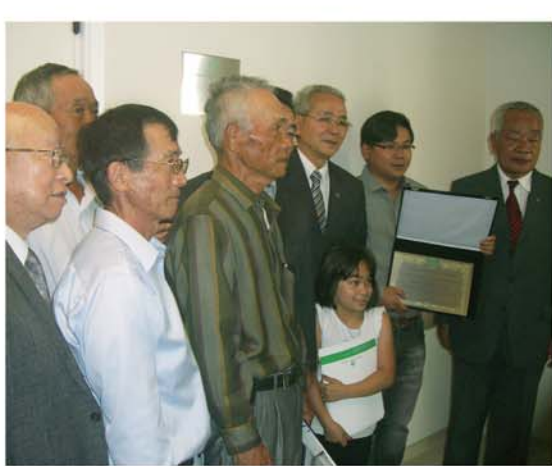
リベIRON・ブランコ日本人会の皆さん。寄付金を基に作られた手術室の前で