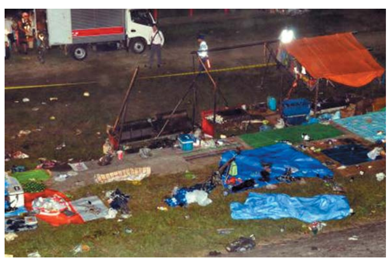
プロパンガスが爆発したとみられる露店の周辺=15日午後10時50分、京都府福知山市

【共同】京都府福知山市の由良川河川敷で15日に起きた福知山花火大会での露店の爆発事故で、負傷者は16日までに385歳の計59人となった。