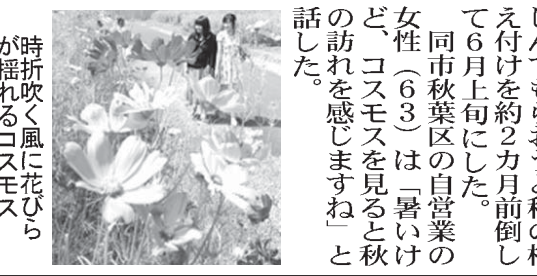
時折吹く風に花びらが揺れるコスモス