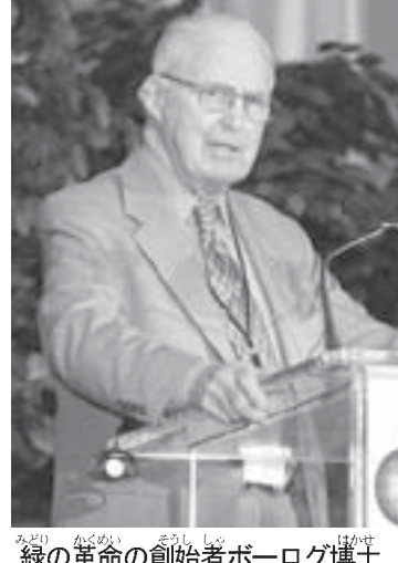
緑の革命の創始者ボーログ博士

それから10年の1995年9月、笹川グローバル2000プロジェクトの主催である笹川良一の息で日本船舶振興会(現在の日本財団)を継いだ笹川陽平理事長、緑の革命の創始者であるボーログ博士、そしてカーター元アメリカ大統領をはじめ、世界の農業専門家約1500人がエチオピアを訪れた。約100名の男女の農民が歓迎の踊りを始めた。見てくれ、この豊作ぶりを。こんないっぱい収穫を喜ぶのは何年ぶりのことだろうか。やっと農業に希望を持つことができるようになった。