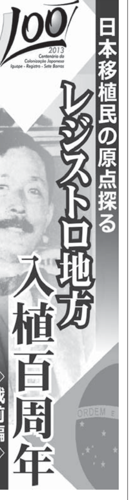
100 Years of Japanese Immigration (1913-2013)