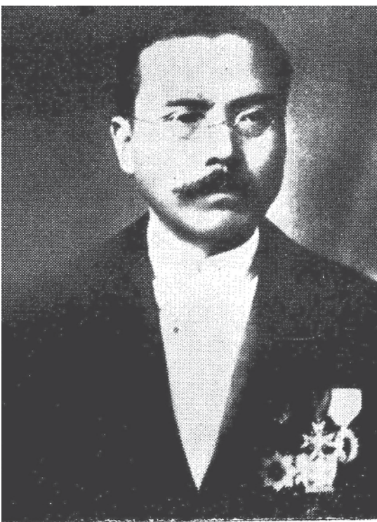
「リベイラ沿岸の神様」とまでいわれた北島研三

「1933年にジボラ...」と語る。北島研三は「リベイラ沿岸の神様」として知られる。