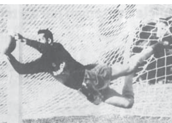
守護神として活躍したジウマール

「伯国史上最高のゴールキーパー」と称され、1958、62年のワールドカップでの伯国優勝にも貢献したジウマールが25日死去した。83歳だった。25日付付字紙が報じている。