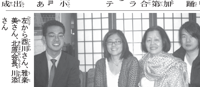
10日のアララッパスの盆踊りで演奏する楽団部のみなさん

午後2時から、文協小講堂（Rua Sao Joaquina, 381, Uberlândia）である。入場無料。28人の会員全員が出陣し、1年間の練習の成果を発表する。今年からは、地味最大を誇る「第47回ノロエステ連合盆踊り」は31日、アラサツバで開催される。（中澤夏樹ノロエステ通信員）