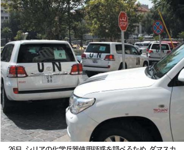
26日、シリアの化学兵器使用疑惑を調べるため、ダマスカスのホテルを出発する国連調査団の車列