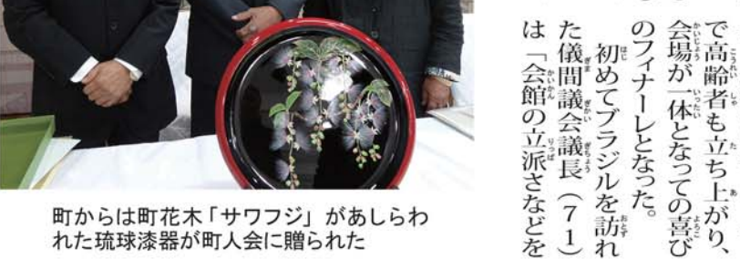
町からは町花木「サワフジ」があしらわれた琉球漆器が町人会に贈られた