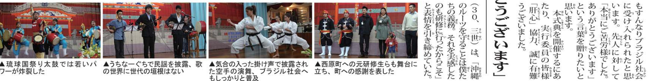
▲琉球国祭り太鼓では若いバワーが炸裂した ▲うちなーぐちで民謡を披露、歌の世界に世代の垣根はない ▲気合の入った掛け声で披露された空手の演舞、ブラジル社会へもしっかりと普及 ▲西原町への元研修生らも舞台上立ち、町への感謝を表した

最初の日本人移民船「笠戸丸」で1908年、当時の西原村から計29人がブラジルに渡った。その後、戦前・戦後を通じて同村から移民は続き、一説には約500家族が移住したと言われている。サンパウロを中心に農業、商業、縫製業など様々な職業分野で活躍。生活基盤の確立とともに村人会結成の動きもあったが、互いに往来するに留まっていた。73年4月、屋良朝苗県知事、平良幸市県議会議長（西原出身、後の知事）、県議会議員団一行の来伯を機に、その機運が盛り上がり、来伯を記念して「在伯西原村人会」が結成された。1979年4月の町制移行に伴い、「在伯西原村人会」から「在伯西原町人会」に改称されている。現在は新年会などの親睦を中心に活動。毎年、町の招聘事業で研修生を町に6カ月派遣するなどしている。なお、ハワイ、ロサンゼルス、ペルー、アルゼンチンにも町人会がある。