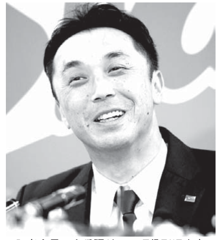
記者会見で今季限りでの現役引退を表明するヤクルトの宮本慎也内野手