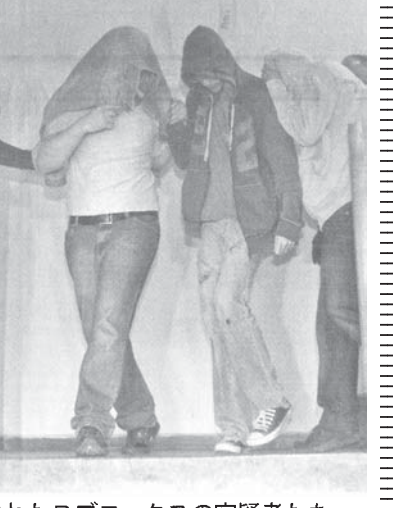
逮捕されたBブロックスの容疑者たち

リオ市警が4日、マニフェストの際に暴力犯罪を働いていた「ブラック・ブロックス」の中心人物と見られる若者5人を暴力行為と犯罪組織形成容疑で逮捕した。5日付フォーリア紙が報じている。8月15日付本紙でも報じたように、聖市やリオ市で顔を隠した「ブラック・ブロックス」と呼ばれる集団が混乱に乗じて、銀行の現金自動預け払い機や商店街を襲うと