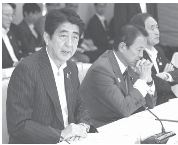
経済財政諮問会議であいさつする安倍首相

【共同】安倍首相が、消費増税を予定通り実施するかどうかの結論を、10月2日に表明する見通しとなったことが3日分かった。政府筋が明らかにした。首相は3日、甘利明経済再生担当相や麻生太郎財務相と官邸で会談し、増税関連のスケジュールなどを議論。首相は10月1日に日銀が発表する9月の企業短期経済観測調査（短観）の結果を確認して最終判断する意向を示した。