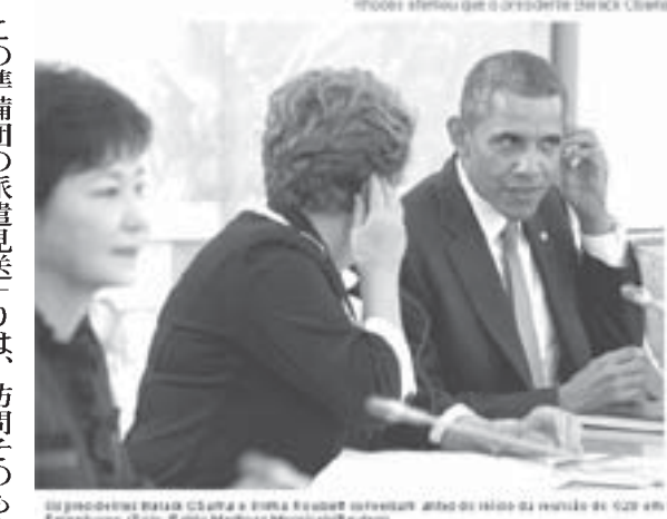
G20の会議直前に言葉を交わすジウマ、オバマ両大統領の写真を掲載したG1サイトの記事