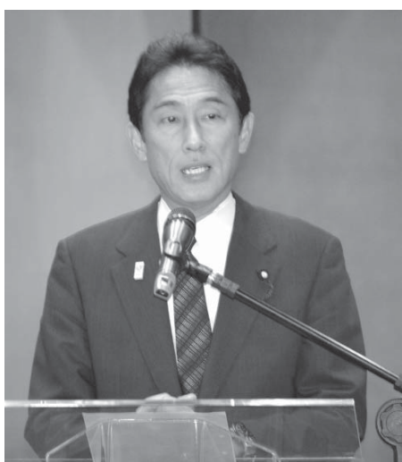
岸田外相は、本紙の取材に対し、観光用査証などのさらなる緩和について「(W杯などの)大きなイベントを控えているだけに、非常に大きな課題。両国の様々な状況、課題について総合的に考えた上で判断していきたい」と述べた。

2日付共同通信の記事によれば、岸田外相から日本製の医薬品や医療機器の販売拡大に向け、ブラジル側の承認手続きを迅速化を検討する政府間協議の創設が提案された。ファイゲイレド大臣は「日系企業がさらに進出しブラジルの発展に貢献してほしい」と要請し、相手国で罪を犯した