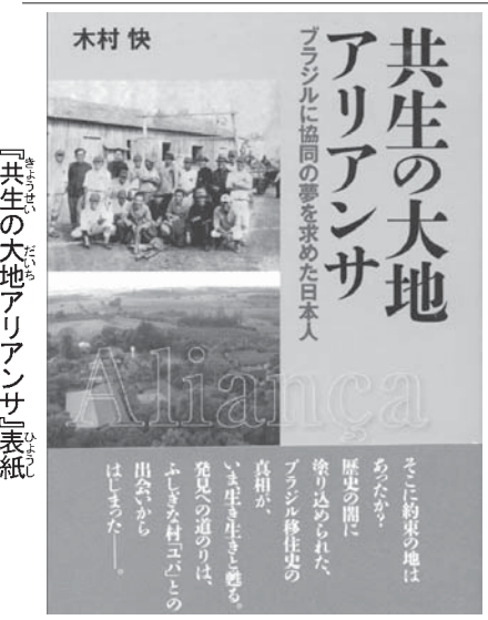
『共生の大地アリアンサ』表紙

専門家に聞きまわったところ、戦前の移住資料は散逸してしまい、日本には移住の専門家もいないという。移住博物館でも「戦前の資料はあつ