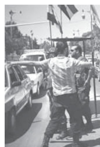
ダマスカスの検問所で、市民のボディチェックをするシリア軍兵士ら

レバノン東部アンジャールから南に数キロ、シリア政府の出国管理事務所ではバスポートに出国スタンプを押す10余りのカンプターに、それぞれ30人以上の長い列。両国間を毎日往復するといふ20代のシリア人運転手は、攻撃間近とみられ