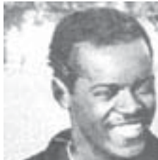
生誕100周年のレオニダス・ダ・シルバ