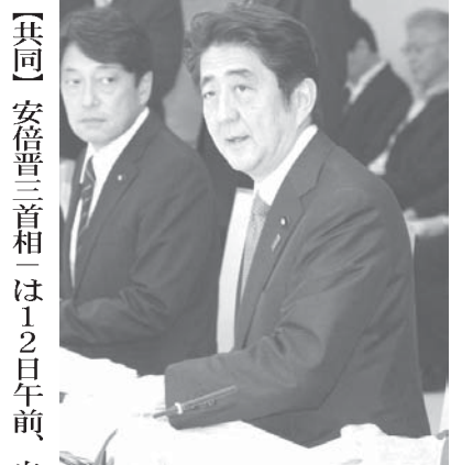
【共同】安倍首相は12日午前、自衛隊幹部を集めて防衛省で開いた会合で訓示し、集団的自衛権の行使容認をめぐり、21世紀の国際情勢にふさわしい我が国の立ち位置を追求していくと述べ、積極的な議論を進める意向を示した。外交・安全保障政策の司令塔となる日本版「国家安全保障会議(NSC)」の創設を見据え、国益を長

期的視点から見定め、国の安全を確保していくために国家安全保障戦略を策定する、と強調した。同時に、「法の支配や海洋の自由」という価値観を共有する国々と連携し、安全保障面での結び付きを強める、と述べ、東シナ海や南シナ海で海洋活動を活性化させている中国をけん制した。