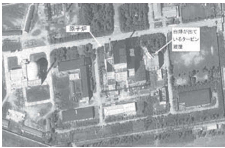
北朝鮮・寧辺の実験用黒鉛減速炉(原子炉)施設。発電用のタービン建屋から水蒸気とみられる白煙が立ち上っている=8月31日

【共同】北朝鮮が核兵器の原料となるプルトニウムの生産に使ってきた寧辺の実験用黒鉛減速炉(原子炉)の復旧作業を完了、既に再稼働させた可能性が高いことが1日、分かった。衛星写真の分析の結果、8月下旬から、再稼働に伴う過程で生じた水蒸気とみられる白煙が断続的に出てきているのが確認された。複数の外交筋が明らかにした。