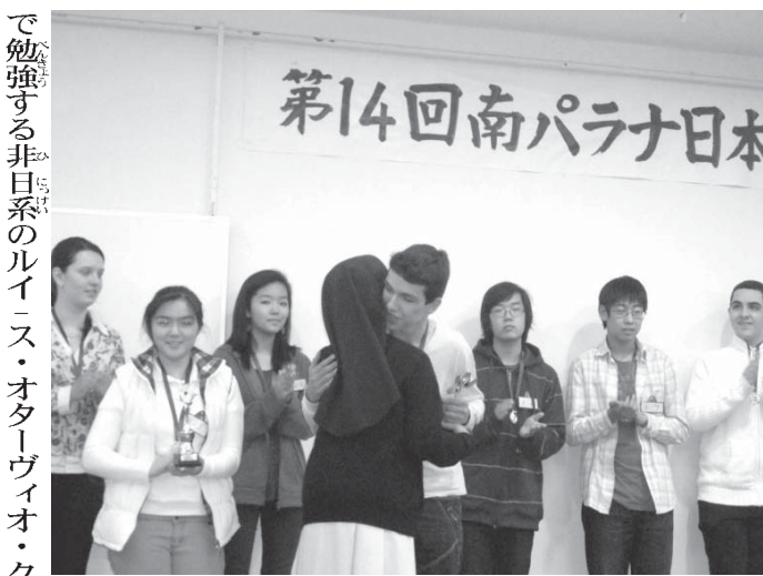
第14回南パラナ日本語朗読大会の様子

同大会の参加・協力校はクリチバ文協日本語講座、CELIN、クリチバ純心学園、大山学園、公文クリチバ・セントロ教室、パラナグア日本語学校、カストロ口漢字学舎、6〜15歳の生徒が年齢別にA〜E組に分かれて参加し、元気いっばいに朗読した。