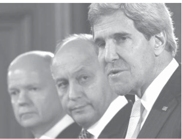
（右）セルストロム団長と（左）潘事務総長が記者会見する（16日、パリ）

【ニューヨーク共同】国連安全保障理事会は16日、シリア問題について協議、化学兵器使用に関する国連調査団のセルストロム団長と潘基文事務総長が調査結果を報告し、使われたサリンはイラン・イラク戦争や東京の地下鉄サリン事件で用いられたものより高品質だったと明らかにした。米国、英国、フランスの国連大使らは記者団に対し、これらの内容から「実行者は政権側」と非難したがロシアは「性急に結論を出す必要はない」と反論した。潘事務総長は「これは戦争犯罪だ。国際社会は実行者の責任を追及する責任がある」と述べた。