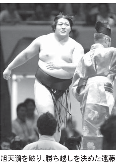
旭天鵬を破り、勝ち越しを決めた遠藤

【共同】大相撲秋場所(25日)の両国国技館。横綱白鵬は関脇妙義龍を右小手投げで何とか逃げ、連敗を免れて1敗で単独首位を守つた。白鵬は、25日の連続した持つ史上最多の連勝記録を40場所の白鵬に伸ばした。