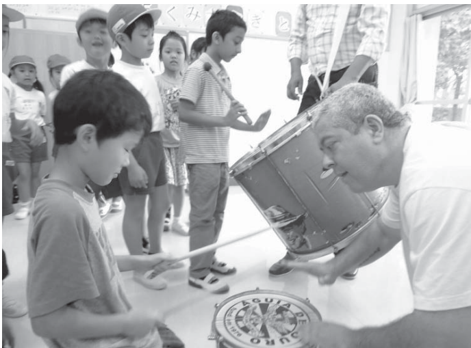
子どもたちに打楽器を教えるシドニー代表

来月14日からフジテレビで始まるドラマ「海の上の診療所」にお笑いのコメディアン「植野」の主演が決まった。初日の主演決定に、帰国支援事業を使って帰国した2万人の仲間の再入国禁止が「解除」された。再入国を希望する約2万人の事業利用者のうち7千人が扶養家族だったという事実をふまえて、「30、40代の家族連れが再入国を希望する層の中心となるのでは」とみている。