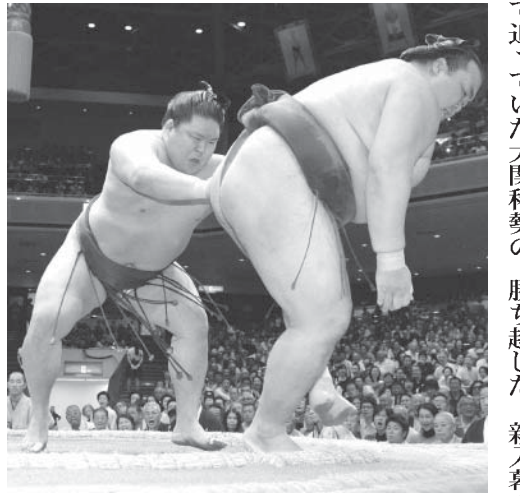
豪栄道(左)が押し出して稀勢の里を破る

【共同】大相撲秋場所13日目(27日)両国国技館。横綱白鵬が大関鶴竜を一方的に押し出し、1敗で単独トップを堅持した。ただ一人2敗を追っていた大関稀勢の里が、稀勢の里に押し出されて3敗に後退した。稀勢の里は、稀勢の里に押し出されて3敗に後退した。稀勢の里は、稀勢の里に押し出されて3敗に後退した。