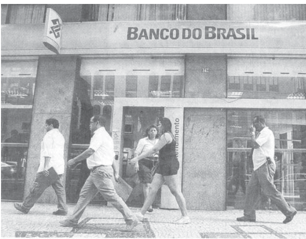
国外に50店舗(うち35が支店)を展開するブラジル銀行。次なるターゲットは中国か

ブラジル銀行が2010年から中国上海に設置している出張所を支店に格上げする。準備中である。支店開設に必要な最終の許可は年内にも下り、10月5日までに開業する見込みだ。26日付日付紙が報じた。