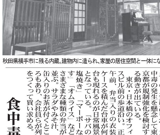
秋田県横手市に残る内蔵。建物内に造られ、家屋の居住空間と一体になっている

【共同】豪雪に備えて建物内に造られた蔵で、秋田県横手市に多く残る「内蔵」が観光客の人気を集めている。豊かな商家が江戸末期から昭和初期にかけて建てた蔵が、集中して現存する。これは全国でも珍しい。流出に悩む市は地域活性化のチャンスとみて、町並みの保存に乗り出した。