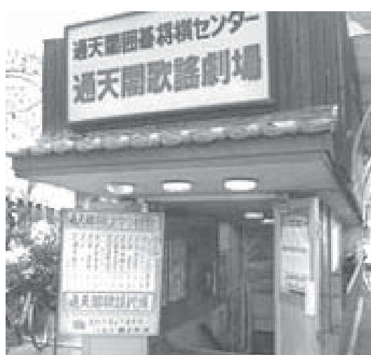
閉鎖した「通天閣歌謡劇場」