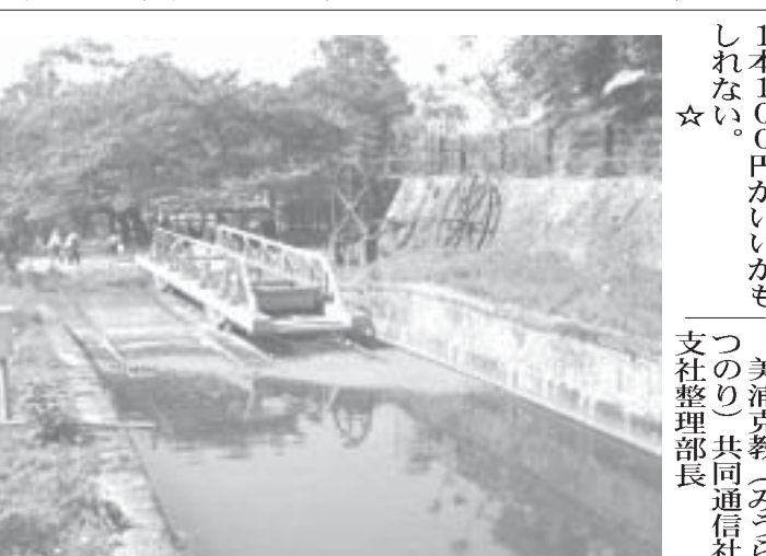
蹴上インクライン

【共同】傾斜面に残る4本のレール。往時は上り下り、ワイヤーにつなげられた2台の台車がケーブルカーのように行き交った。ただし積み高は船、標高差のある水路と水路の間を、人や荷物を船ごと運んだ。滋賀県の琵琶湖の水を京都市内に引いた琵琶湖疏水には、傾斜鉄道「インクライン」の遺構がある。 琵琶湖疏水は明治維新の東京遷都後に計画。水運を興し、水運を