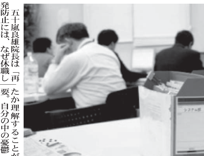
疑似職場で作業する患者ら

【共同】うつ病など精神疾患の原因とされるストレスが原因とされる精神疾患の患者数が約100万人と急増。休業や治療で仕事を休職する人が少なくない。だが、治療を受け復職しても何らかの理由で再休職する例が少なくない。再休職を防止する「うつ病などから復職支援プログラム」が提供されている。医療機関が増えている。 【共同】うつ病など精神疾患の原因とされるストレスが原因とされる精神疾患の患者数が約100万人と急増。休業や治療で仕事を休職する人が少なくない。だが、治療を受け復職しても何らかの理由で再休職する例が少なくない。再休職を防止する「うつ病などから復職支援プログラム」が提供されている。医療機関が増えている。