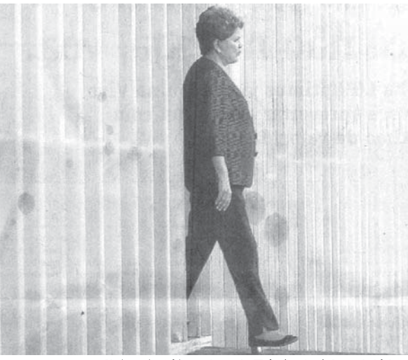
マリナ氏の動向に気が気でないと言われるジウマ大統領

【既報関連】5日に電撃発表された、マリナ・シウヴァ氏のブラジル民主党(PSB)加入は、ジウマ大統領をはじめとしたPT(労働者党)と、その最大の政敵である民主社会党(PSDB)にも大きな波紋を投げかけている。7日付付伯紙が報じている。