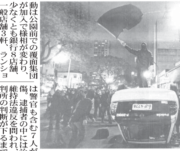
聖市での抗議行動で反転した警察車両

動は公園前での覆面集団加入で様相が変わり、少なくとも銀行8店舗、一般店舗3軒、ランシヨネット2軒を襲撃。ゴム製の石投げ器で炎瓶を投げる姿や、警察車両を反転させる様子などがテレビにも流れた。