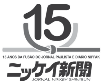
15 ANOS DA FUSÃO DO JORNAL PAULISTA E DIÁRIO NIPPAK