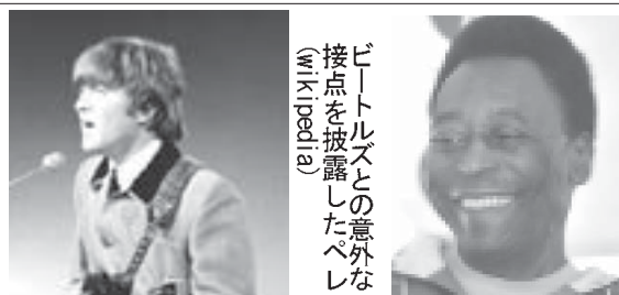
「ビートルズとの意外な接点を披露したペレ」(Wikipedia)

「サッカーの王様」と呼ばれたペレが、15日に行われた自身の伝記『1283』の発売記念イベントで、60年代に世界的に活躍したロックバンド、ビートルズと自身にまつわる秘話を披露した。