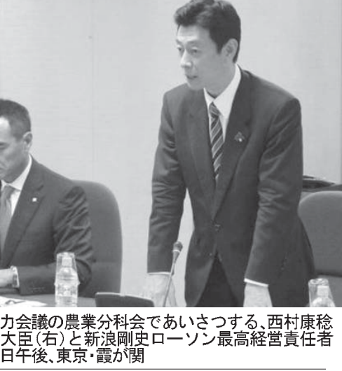
産業界の農業分科会(右)と農水省(左)の会合。24日午後、東京・霞が関内閣府副大臣(右)と農水省副大臣(左)が出席。

【共同】政府は24日、産業競争力会議の農業分科会を開き、コメの生産調整(減反)や経営所得安定対策を見直す方向で検討を始めた。