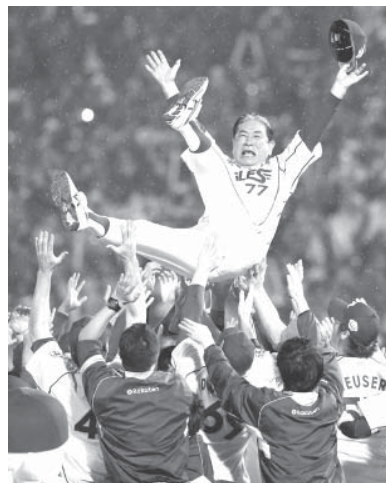
日本一に輝き、胴上げされる楽天の監督亀谷将司