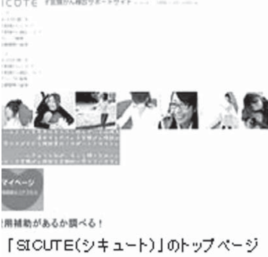
「SICUTE(シキユート)」のトップページ

【共同】子宮頸がん(けいがん)の検診受診率が先進国で最低レベルとされる日本。特定の年齢への無料クーポン配布など経済面で受診を促す施策はあるが、視点を「敷居が低くなるか」を、受診する女性の立場で考えた試みも出てきた。インターネットを使った情報提供と、女性に評判が悪い「内診台」を見直すという二つを紹介する。