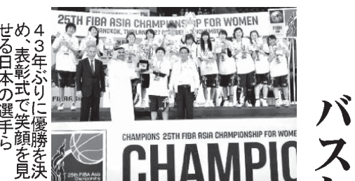
43年ぶりに優勝を決めた日本の選手たち

【共同】バスケットボール女子のアジア選手権は3日、バンコクで行われ、決勝で世界ランキング1位の韓国が同1位の日本を65-43で快勝し、1970年大会以来43年ぶりに2度目の優勝を果たした。1次リーグから7戦全勝の日本は韓国、3位中国とともに来年の世界選手権（トルコ）に出場する。