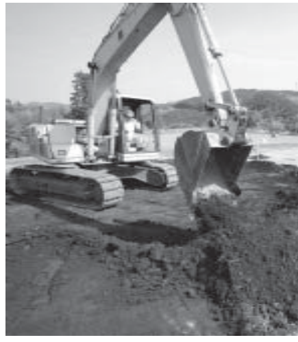
除染のため重機で削り取られる農地の表土=2012年、福島県飯館村長

【共同】東京電力福島第1原発周辺の除染に関する政府の見直し案が1日、判明した。除染費用として1兆円超を国が投入する。除染に伴って出る廃棄物を保管する中間貯蔵施設の建設と、生活再建に向けたインフラ整備に付随して追加的に発生する除染に充てる。自民党が提言に盛り込んだ国費負担を受け入れる方向だ。一方、国や自治体はこれまで計画した除染費用は最大3兆円程度になる見込みで、この部分は従来方針通り東電の全額負担とする。政府は東電の除染負担額が固まった段階で、交付国債の発行枠を現在の5兆円から8兆9千9百兆円に拡大し、東電の資金繰りを支える方針だ。国費投入により、復興加速へ国が前面に出る姿勢を示す。