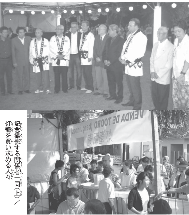
記念撮影する関係者(同上)／灯籠を買い求める人々

伯国のお盆、死者の日(フィナードス)に合わせ、伝統の「第59回レジストロ灯籠流し」が2日、リベイラ川沿岸のペイラ・リオ広場で開催された。レジストロ地方移民入植百年祭実行委員会、同市の日任文化協会、市役所、文化体育協会、日蓮宗恵明寺の共催。移民入植百年式典のため来賓として、姉妹提携都市の岐阜県中津川市から慶祝団11人が参加し、約3万人が日本の伝統行事で先祖を偲んだ。