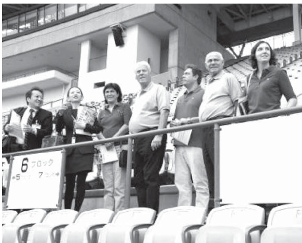
神戸市のユニバー記念競技場に訪れた「ワールドマスターズゲームズ」主催団体の視察団