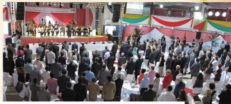
▲当日の会場の様子

1913年に建設された桂植民地にはじまる同地域の開拓史を振り返る映像が流されたほか、飯星ワルテル両連邦下議、功労者への感謝状授与、来賓のサムエル・モレイラ聖州議会議長、安部順三連邦下議らから、福島教団在聖領領事からの祝辞が述べられた。ファンチン市長からの「日本からの最初の永住者」を記念する式典もあつた。