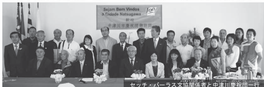
セッチ・パラス文協関係者と中津川慶祝団一行