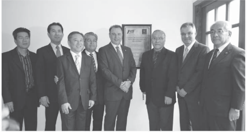
別館内には記念のプラッカが設置された