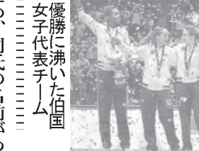
優勝に沸いた伯国女子代表チーム