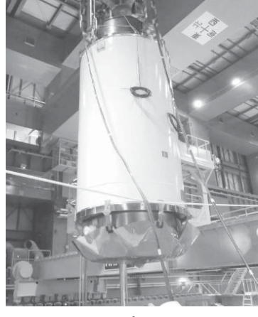
取送燃料輸送容器（キャスク）に装填する未使用燃料。東京電力福島第1原発4号機燃料プールで撮影。同日午後11時45分ごろ

【共同】東京電力は18日、福島第1原発4号機の使用済み核燃料プールの保管している燃料の取り出しを始めた。廃炉が決まった15333体から本格的な燃料取り出しは2011年3月の東日本大震災に伴う事故以来、初めて。政府、東電が示す廃炉工程の大きな節目で、3期に分かれた工程のうち、原子炉の安定的な冷却維持などで、第1期から第2期に移行した。4号機の15333体の燃料取り出しは来年末に完了する予定。4号機での作業が予定通り進まない場合、その後の廃炉工程に影響が出る恐れがある。今回は作業員の習熟訓練も兼ねて、強い放射線を出さず比較的扱いやすい未使用燃料22体を燃料輸送容器（キャスク）に装填する。