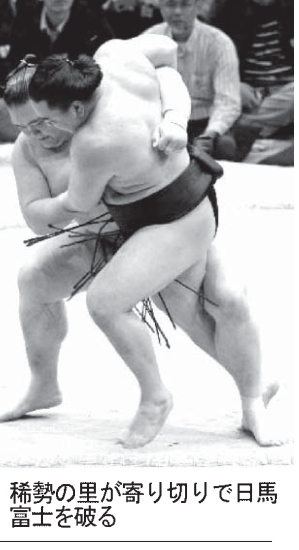
稀勢の里が寄り切りで日馬富士を破る

白鵬を1敗で日馬富士、2敗で稀勢の里が追う。十両は千代鳳が2敗で単独トップに立った。