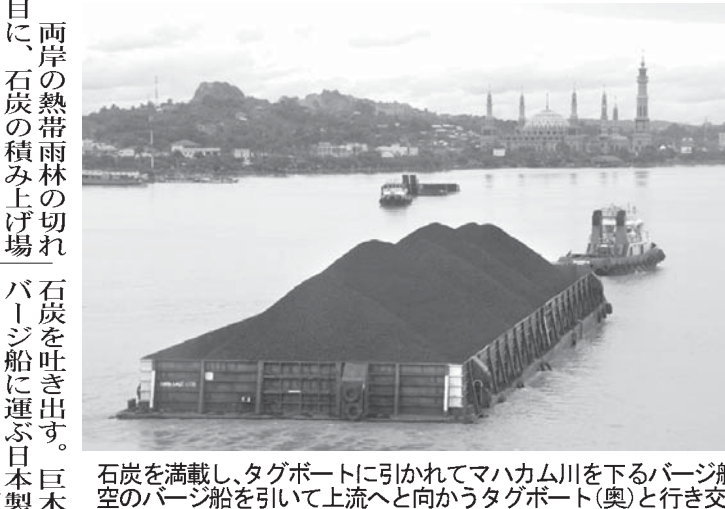
石炭を満載し、タグボートに引かれてマハカム川を下るパーズ船。空のパーズ船を引いて上流へと向かうタグボート(奥)と行き交う。＝サマリタ(共同)

【共同】赤道直下、インドネシアのカリマンタ(ボルネオ)島を流れるマハカム川。全長920キロの大河は、密林で暮らす先住民の生活を支えてきた。木々に覆われた大地には石炭や金など豊富な天然資源が眠り、先住民の交通路だった大河は今、活況を呈する天然資源開発の大動脈でも