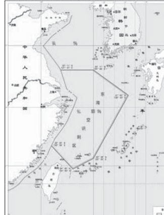
中国国防省の楊宇軍報道官は、尖閣諸島の領土に設定した防空識別圏は中国固有の領土に設定されており、完全に正当であると述べた。