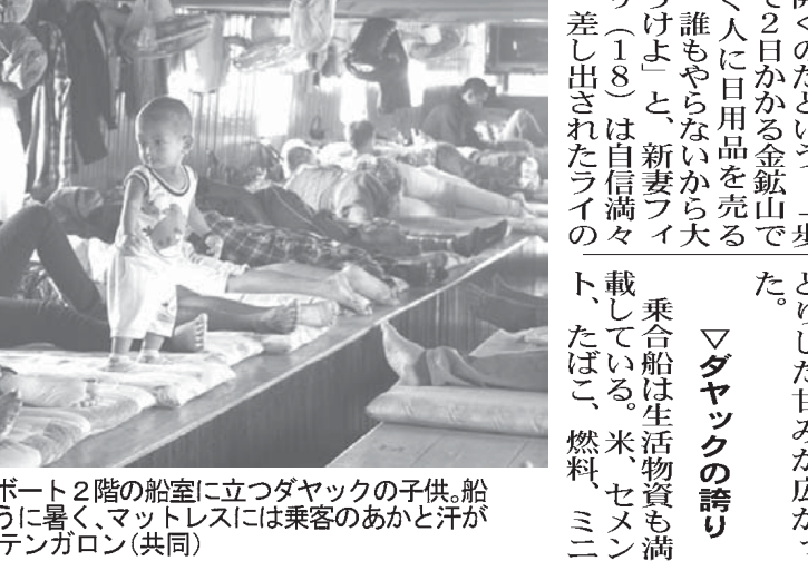
上流へ向かう公共ボート2階の船室に立つダヤックの子供。船内は蒸し風呂のように暑く、マットレスには乗客のあかと汗が染みついていていた。＝テンカロン(共同)

【共同】赤道直下、インドネシアのカリマンタ(ボルネオ)島を流れるマハカム川。全長920キロの大河は、密林で暮らす先住民の生活を支えてきた。木々に覆われた大地には石炭や金など豊富な天然資源が眠り、先住民の交通路だった大河は今、活況を呈する天然資源開発の大動脈でも