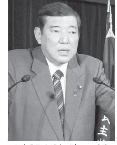
記者会見する自民党の石破幹事長。25日午前、東京・永田町の党本部。

【北京共同】中国外務省の秦剛報道局長は25日の定例記者会見で、23日に沖縄県・尖閣諸島付近を含む東シナ海の上空に設定した防空識別圏をめぐり、他地域についても「適宜発表していく」と述べ、南シナ海や黄海でも設定作業を進めていることを示唆した。