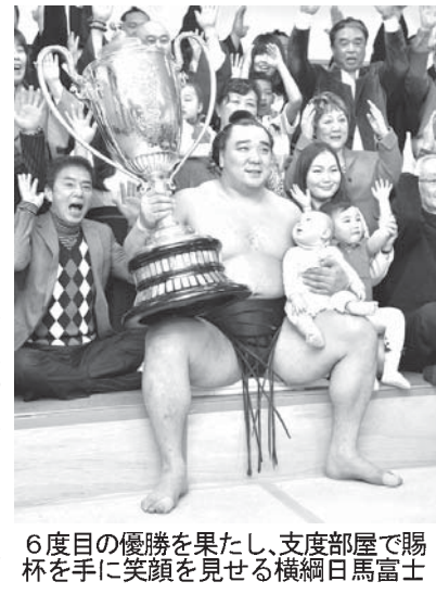
6度目の優勝を果たし、支度部屋で勝杯を手に笑顔を見せる横綱日馬富士

【共同】大相撲九州場所千秋楽(24日・福岡国際センター)2008年春場所の朝青龍-白鵬以来となる横綱同士が白星決戦で、日馬富士が白鵬を寄り切り、14勝1敗で初優勝した。白鵬は2連敗で、九州場所制覇が6年連続で途切れた。