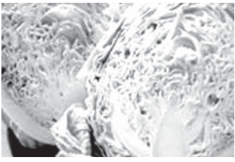
新鮮な春キヤベツ