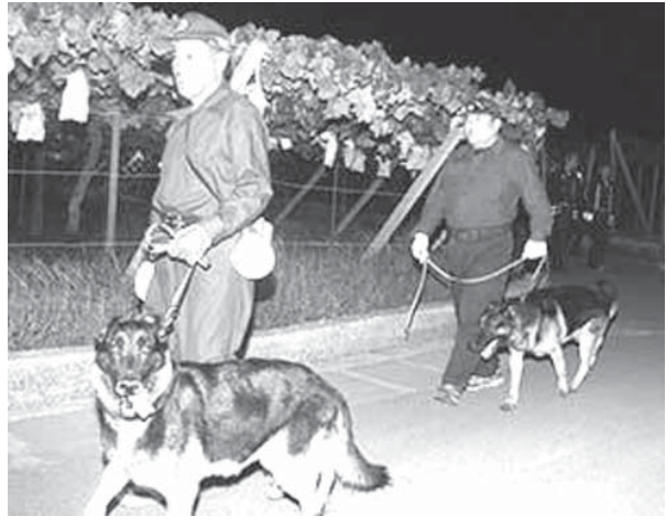
ブドウ盗難防止パトロールをする警察犬。近年は事件捜査以外の場面でも警察犬が活動するケースが増えている