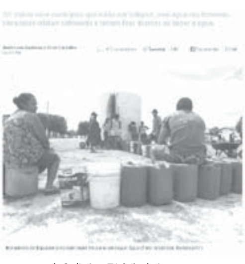
水を求めて列をなす人々

生活扶助も飲み水代に タンクの前に8時間並ぶ 春になれば全国的に雨が降ると期待されていた中、北東伯は水力発電用の貯水湖の水位が22・05%まで減り、リオ・グランデ・ド・ノルテ州(北大河)では毎日使う水もタンクの前に8時間並ばないと手に入らないなど、干ばつの影響が依然として続いていると11月30日付エスタド紙や3日付G1サイトなどが報じている。 地球温暖化などの影響で干ばつや豪雨といった異常気象が激化する中、北東伯で干ばつが起きているとの報道は2012年から繰り返され、野菜や果物も収量激減などのニュースは警報でも伝えてきたが、3日付G1サイトの記事は、この2年間はシャワーを使わずひよろんで済んだ水で入浴という女性や、地域にある貯水タンクの水を取りに行くために夜中の3時半に家を出るが正午を過ぎて水が汲めぬという北大河州民の生活を報道。州政府も、干ばつは1年以上続いており、直近50年間で最悪と評価している。 「セルトン」での生活は12年から繰り返され、家畜の屍が置かれ、野菜や果物も収量激減などのニュースは警報でも伝えてきたが、3日付G1サイトの記事は、この2年間はシャワーを使わずひよろんで済んだ水で入浴という女性や、地域にある貯水タンクの水を取りに行くために夜中の3時半に家を出るが正午を過ぎて水が汲めぬという北大河州民の生活を報道。州政府も、干ばつは1年以上続いており、直近50年間で最悪と評価している。