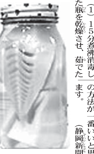
瓶詰にしたタケノコ