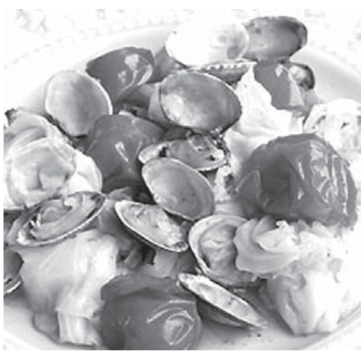
春キヤベツとアサリの旬まるごと蒸し