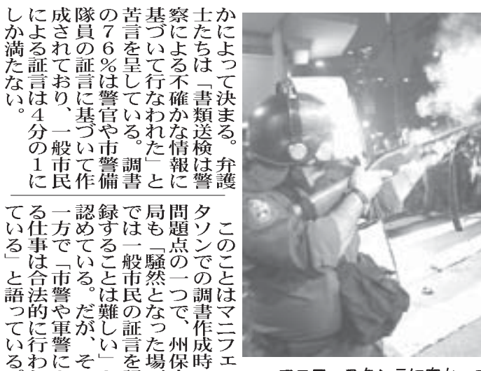
マニフェスタソンに向かってゴム弾で対応する軍警

6月に全国規模で広まった「マニフェスタソン」(抗議の波)のきつかけは、聖市で行われた無賃乗車運動(パッセ・リブレ)による抗議行動だが、一連の抗議行動で最初の逮捕者がでてから今日で半年になる。この間に聖州警察は、抗議行動絡みで逮捕した人の約3分の1を書類送検したことがわかった。5日付フォーリヤ紙が報じている。 同紙によると、聖州での抗議行動では、6月6日以降10月までに警察に連行され、市警による調査が作成された人(以下、逮捕者)は374人で、調査の数は160件に上る。連行されたが犯罪行為には加担しなかったと判断された人は調査をとった後に釈放されたが、犯罪行為を行った人は書類送検された。17人は書類送検された。一連のマニフェスタソンは、当初から、学生をはじめとした若年層が中心となっており、逮捕者全体の約半分にあたる49%は18〜24歳で、21%に当たる80人がそれ以下の少年層だ。また、学歴の比較的高い人たちが目立ち、「高卒以上」が逮捕者全体の59%を占めている。その中で、「高校卒業」が25%、「大学過程未終了(在学中か中退)」が20%、「大学卒業」が14%となっている。また、逮捕者の39%が学生で、4%が教員、7%は逮捕時に無職だった。逮捕者の79%は男性、20%は女性で、残り1%は調査からは確認できなかった。全体の半分は白人だが、26%は他の人種が不明だった。また、今回、警察が犯罪として登録した罪状は、「器物破損」が最も多く、「窃盗」「傷害」「物品押収」「組織犯罪計画」が続く。「刑罰」は「窃盗」が最も多く、「物品押収」「組織犯罪計画」が続く。「刑罰」に値するが、判断した際に「窃盗」が最も多く、「物品押収」「組織犯罪計画」が続く。「刑罰」に値するが、判断した際に「窃盗」が最も多く、「物品押収」「組織犯罪計画」が続く。