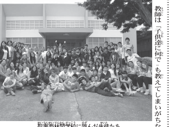
聖南西林間学校に臨んだ生徒たち

活動に生かしていくことを目的として、日本でも学校や企業、自治体の新入社員研修などに取り入れるなど普及が広がっているという。3日間を通して生徒達に考えさせ、初めは空白が目立っていた記入用紙も、巨大画用紙も、進むにつれ「わがままを言わない」「あきらめない」など次々に書き加えられ、閉校式にはどの班もきりりと埋まっていた。教師は「子供達に何でも教えるというべきではない、考えること、話すこと、気がついてほしい」と、子供自身が考えることの重要性を説いた。生徒同士、先生と生徒との交流を目的とする林間学校などの地区行事を行うのは、教師にとっては大変に手間がかかる。だが、生徒が交流を通して団体行動、集団生活に大事な事を学ぶ場であり、教師らはそれを重視して毎年継続している。