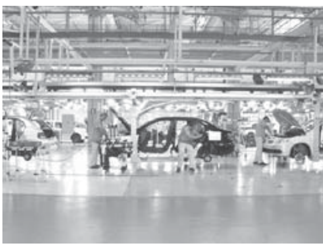
フォルクスワーゲンのタウバテール工場の生産ライン

年末時点で在庫が積みあがっていると言え、自動車業界はシュロス業界や繊維業界と比べると、2012年と同等の状況。つまり一部の企業に限って長期の連休とする。2012年末の場合、連邦政府の振興策を受けて2011年比で休暇期間を縮小した。