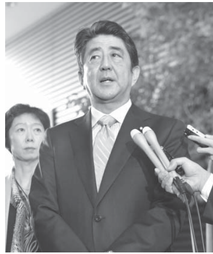
安倍首相は記者の質問に答える。17日午前、首相官邸

【共同】政府は17日、外交と安全保障政策の初の包括的指針となる「国家安全保障戦略」と、今後10年程度の防衛力整備の指針「防衛計画の大綱」を閣議決定した。