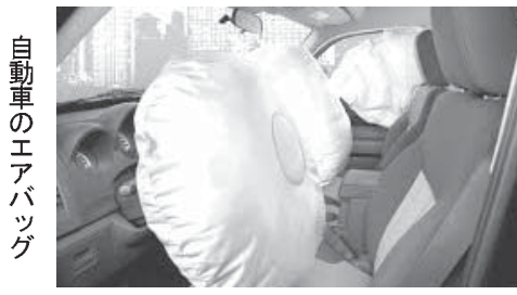
自動車のエアバッグ

政府は、2014年1月からエアバッグとABSが装着義務化されることと車体価格が上昇することを受け止めている。その上で、この値上がりがインフレ率を押し上げるのを懸念している。Euros5への対応に伴うトラックの価格が15%上昇し、既に販売を大きく圧迫。雇用の削減につながっていると指摘する。同様の状況が2014