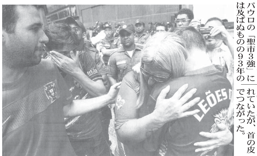
悲しみにくれるルーザのファンたち

だが、最終戦直後に違反が指摘され、スポーツ高等裁判所に訴えられた。11日の裁判では予想通り、5対0でルーザの違反が決まり、ルーザは1勝分の勝ち点(3点)と違反による減点(1点)の計4点で減点され、勝ち点4で17位に降格。100万レアルの罰金も言い渡された。11位だったフルミネンセも同様の違反が発覚で4点減点となり、勝ち点4で16位に落ちたが降格を免れた。