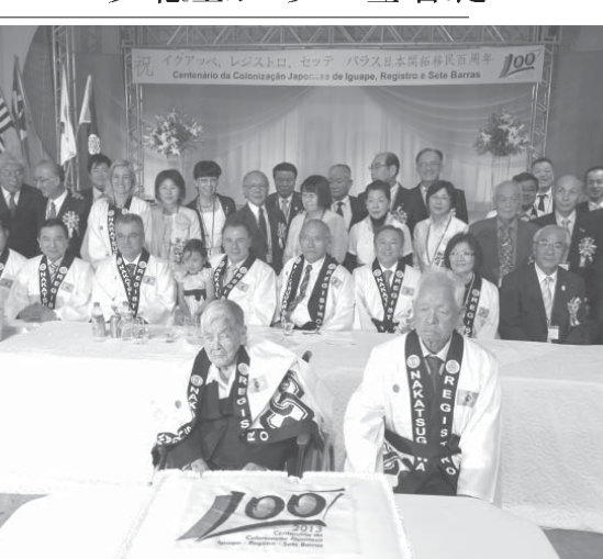
10月の記念式典で主催者と来賓が集まった記念写真

笠戸丸移住から105年目にあたる今年、美に16の県人会にとつても節目の年となり、10以上が知事ら母県の要人を招き、記念式典を開催した。