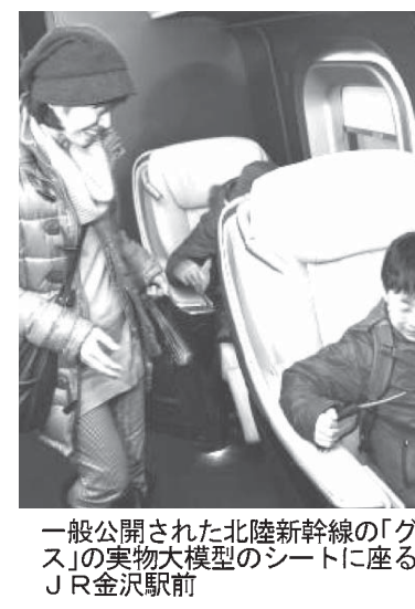
一般公開された北陸新幹線の「グランクラス」の実物大模型のシートに座る男子

【共同】北陸新幹線長野～金沢間の延伸開業を2015年春に控え、JR西日本は14日、金沢駅(金沢市)の駅前広場で新型車両「E7系」W7系を導入される最上級の「グランクラス」座席を再現した実物大模型を初めて一般公開した。