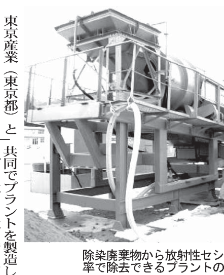
除染廃棄物から放射性セシウムを高効率で除去できるプラントの一部

【共同】東京電力福島第1原発事故に伴う除染廃棄物から、放射性セシウムを高い効率で分離する新技術を開発した。三井金属と神通川流域カドミウム被害者団体連絡協議会(被団協)が合意した。新技術は、5マイクロメートル(マイクログラム)の土壌に多く吸着するセシウムの性質を利用し、土壌を粒子の大きさによって振り分けるサイクロン式装置で作業を数回繰り返して、セシウムを多く含む微粒子の土壌を分離し吸着剤で固化、除