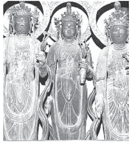
松山市の太山寺(52番)で拝観できる重要文化財の十一面観音像

【共同】弘法大師空海が平安時代の815年に開創したと伝えられる四国八十八ヶ所霊場が2014年に1200年目を迎える。1月から88寺の多くで秘仏や宝物が公開される。多くのお遍路さんでにぎわいそう。