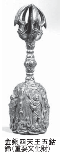
金銅四天王五鉢鈴(重要文化財)

1月25日、徳島市の井戸寺(17番)は毎月18日、松山市消防出初め式が7日、青葉区の勾当台公園市民広場であった。