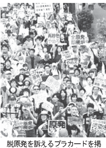
掲げた再建計画の東京電力役員ら。15日、東京電力の再建計画を認定する閣議で、菅首相（左）が認定書を受け、野田首相（右）が認定書を授け、両首相は認定書を掲げて記者会見を行った。

【共同】政府は15日、国による支援拡大を柱とする東京電力の新たな総合特別事業計画（再建計画）を認定した。福島第1原発の廃炉を着実に進める一方、持ち株会社制の導入や電力販売の全国拡大など経営強化に向けた主要施策を2016年度までの3年間で集中的に実施し、経営再建を軌道に乗せることを目指す。