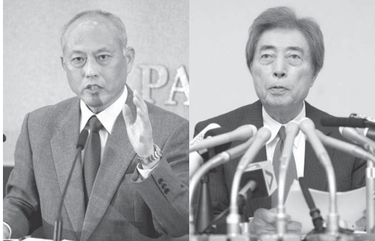
東京都知事選挙の告示を前に、記者会見する舛添要一(左)と細川護国氏(右)＝22日午後、東京

【共同】猪瀬直樹氏の辞職に伴う東京都知事選挙が23日告示される。原発・エネルギー政策や2020年東京五輪に向けた対応が主な争点。元首相の細川護国氏(76)は22日、都庁で記者会見し、出馬を正式表明した。元厚生労働相の舛添要一氏(65)、前日弁連会長の宇都宮健児氏(67)も同日記者会見し、出馬を正式表明した。政策を訴えた。