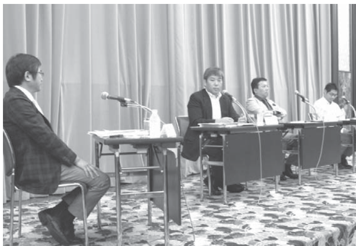
限定正社員をテーマにした討論会＝東京都千代田区

【終身雇用と年功賃金が柱の日本型雇用の弱点は、転勤や職種転換、残業を拒否できない正社員「無限定性」に尽きる。任地や仕事の内容