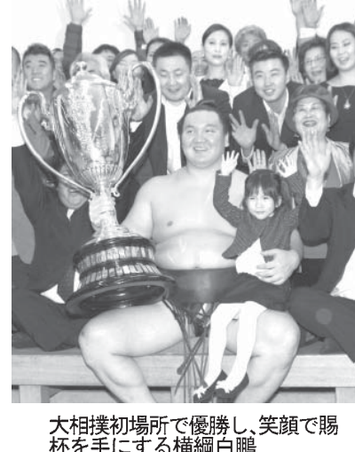
大相撲初場所、鶴竜が優勝し、笑顔で賜杯を手にする横綱白鵬

【共同】大相撲初場所千秋楽(26日)両国国技館。横綱白鵬が14勝1敗で並んだ大関鶴竜との優勝決定戦に勝ち、2場所ぶりの制覇で歴代3位の優勝回数(28)に伸ばされた。白鵬は鶴竜に寄り倒されたが、決定戦で寄り切った。幕内の優勝決定戦は2012年夏場所の旭天鵬(栃煌山)以来。鶴竜について日本相撲協会の北の湖理事長(元横綱)は来場所が綱とりになるとの見解を示した。稀勢の里が休場し、大関琴奨菊は不戦勝で9勝6敗。稀勢の里は春場所が初のかど番となる。