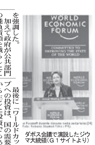
ダボス会議で演説したシウマ大統領(G1サイトより)

「世界経済フォーラム」は1971年に設立された国際機関として設立された約2500人の選ばれた知識人やジャーナリスト、多国籍企業経営者や国際的な政治指導者などが一堂に会し、世界が直面する重大な問題について議論を行う場となっている。