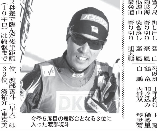
今季5度目の表彰台となる3位に入った渡部暁斗

W杯複合で渡部 3位 【共同】ソチ五輪女子ジャンプのワールドカップ(W杯)複合は26日、ドイツの渡部暁斗(北野建設)が3位に入り、今季5度目の表彰台に立った。首位と3