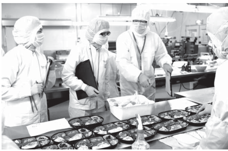
「コープデリタ宅宅配」の厳格な商品検査の様子

弁当を毎日自宅まで運んでくれるサービスが、高齢層を中心に利用者が広がっている。1食500円前後が中心で、栄養バランスの良さや塩分控えめをうたったり、地産地消をPRしたりと業者ごとにサービス内容も多彩。弁当を作り上げるスタッフに高齢者が起用されるケースも多く、弁当宅配は高齢の