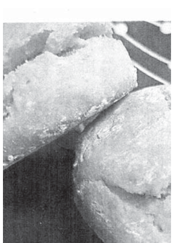
カボチャスコーン

作ってみよう （1）カボチャはレンジで加熱し、熱いうちにつぶす。 （2）ピーンル袋に薄力粉、ベーキングパウダー、グラニュー糖、塩を混ぜる。 （3）（2）をボウルに移してオリブ油を加え、パン粉状まで混ぜる。 （4）（3）に（1）と