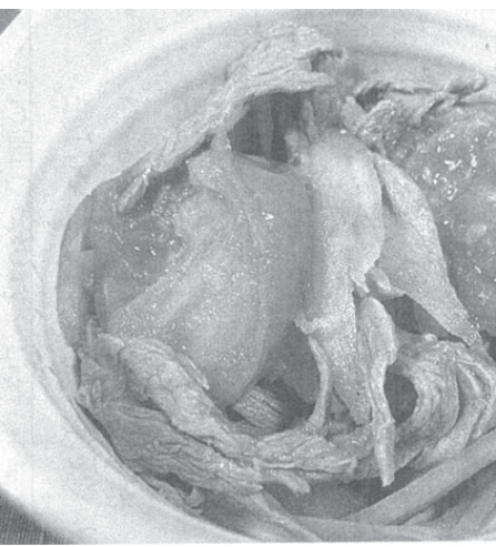
牛肉とゴボウの和風トマト煮

が遅くなる時は、夕方ににおにぎりやサンドイッチなどの軽食を取り、帰宅してから軽めの食事で補うといいでしょう。今回は遅い時間の夕食に適した、カロリーが低く繊維を多く含むレシピを紹介いたします。