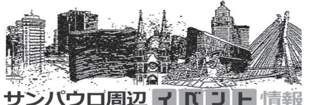
サンパウロ周辺 イベロポト 情報

ブラジル人が大好きなアイスクリーム。特に夏は南米の国らしく、マンゴリーやレモン、パイナップルやスイカなどの季節フルーツが楽しめる。アイスクリームの存在として注目されるのが「ソルヴェティア」だ。この店は日本でも展開されている米国のチェーン店だが、当地にも聖市にも1号店がモエマにできたばかり。店員が歌って踊りながらアイスを作るスタイルが特徴だが、伯国でも通用する見ものだ。(13日付G1サイトより、4日掲載)