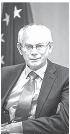
俳句の愛好者として知られるバイ大統領フアンロン