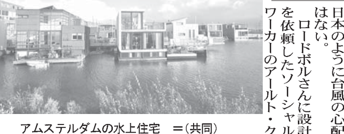
アムステルダムの水上住宅(=共同)

された」と説明。温暖化による水面上昇に対応する実験の側面もあると強調する。 「水に閉まれ、住民はこれまでと違う暮らしをした」と説明。温暖化による水面上昇に対応する実験の側面もあると強調する。 「水に閉まれ、住民はこれまでと違う暮らしをした」と説明。温暖化による水面上昇に対応する実験の側面もあると強調する。