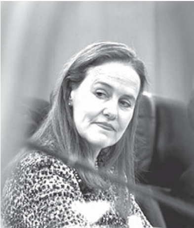
「日韓関係の修復が最優先」と述べたミシェル・フロノ元国防次官

【共同】1期目のオバマ政権の国防政策を担ったミシェル・フロノ元国防次官が、東京で講演し、東アジアの安定には「日韓関係の修復が最優先」と述べた。