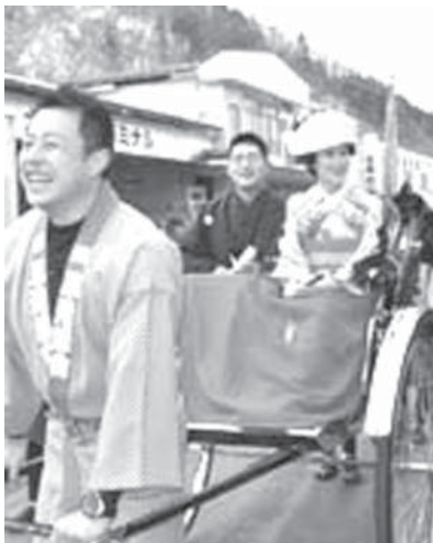
花嫁道中で沿道の観光客に笑顔を見せる夫妻

【共同】川勝平太知事は、世界遺産登録後に初め迎える「富士山の目」を前にこのほど、成資産(富士宮市)で対談した。年々増加傾向にある富士登山者数について、昨年(2013年)の世界遺産登録後に訪れた31万人程度を上限にすべきとの認識を一致した。