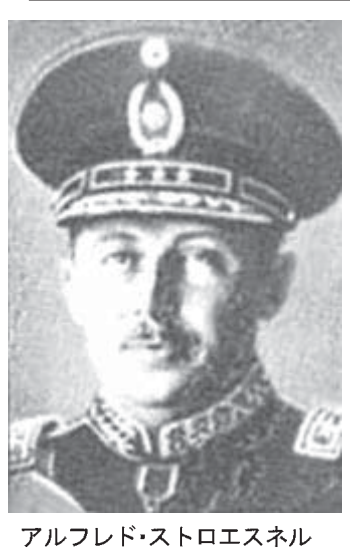
アルフレド・ストロエスネル

この機会をもしも逃すような事でもなければ、パラグアイは大変惨めな国に苦しみ続ける事になる。いつになれば後進国の運命から脱却できるのか分からなくなるだろう。さもなければ希望のない国に成り果て、挙げ句は貪欲な隣国の何れかに併呑されて仕舞うかも知れない。遅くならない中に速く適切な手を打つべく、救国の行動を断乎として起さなければならぬのだ。(註:此の記事はラ・ナシオン紙のアルベルト・ヴァルガス・ペーニャ論説委員の論評を参考にしたものです。)