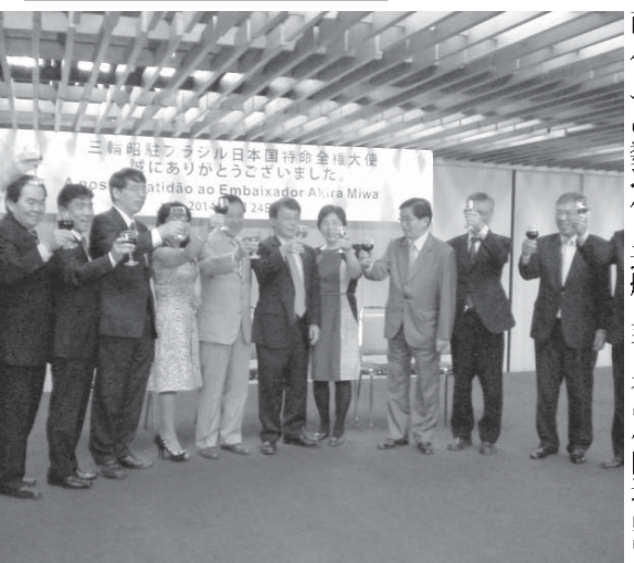
笑顔で三輪大使(中央)を囲む関係者一同

在ブラジル日本国大使館の三輪昭特命全權大使の送別会が24日夜、文協ビル貴賓室で開催された。日系34団体の代表者や、日本から関係者や、日本から外務省の山田中南米局長など、約150人が