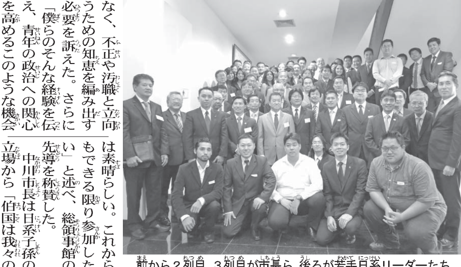
前から2列目、3列目が市長ら。後ろが若手日系リーダーたち