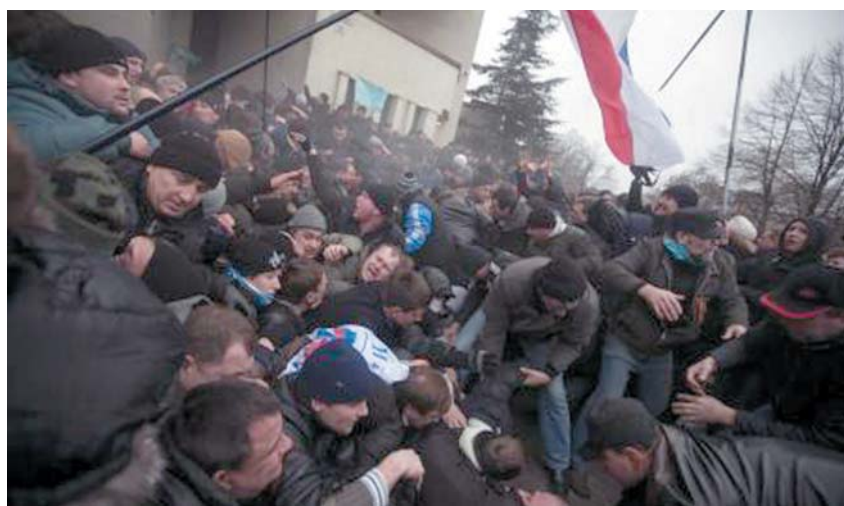
26日、ウクライナ南部クリミア半島シンフェロポリで、小競り合いをする新体制支持派と親ロシア派の住民