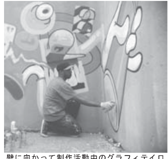
壁に向かって制作活動中のグラフィティ

「区役所の人と会議も開いたが、イベントの詳細はグループによって全て決められていた。時間や道程を提案する機会もなかった」と、行政やイベント主催者と住民側の対話不足を強調する。