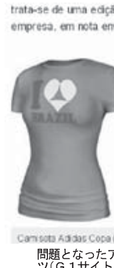
問題となったアディダス社のTシャツ

アディダス新作のTシャツ販売停止。ブラジルからの苦情受け。アディダス新作のTシャツ販売停止。ブラジルからの苦情受け。