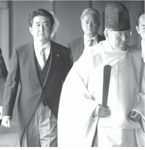
靖国神社を参拝した安倍首相=2013年12月

【ワシントン共同】安倍晋三首相の靖国神社参拝に端を発した歴史認識問題をめぐる日本政府要人の言動に、オバマ米