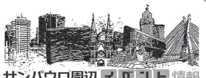
サンパウロ周辺イベント情報

アディダス新作のTシャツ販売停止。ブラジルからの苦情受け。アディダス新作のTシャツ販売停止。ブラジルからの苦情受け。