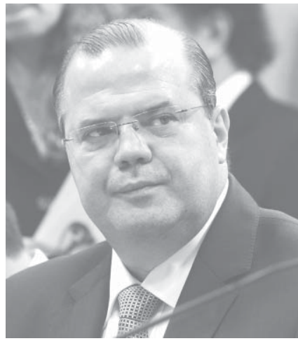
中銀のトンビニ総裁

13年の経済成長率は地理統計院(IBGE)が27日に発表したもので、同年第4四半期は前期比で0・7%成長し、年間成長率も2・3%に達した。13年のGDPは、第1四半期が前期比ゼロ成長、第2四半期は1・8%成長したものの、第3四半期は0・5%のマイナス成長で、2期連続マナス成長で、2期連続マナス成長となるリセツシヨン(景気後退)の懸念さえ囁かれた。だが、第4四半期は市場の予想(0・5%)を若干上回る0・7%の成長となり、年間成長率を2・3%に押し上げた。この数字は、前年の1%を大きく上回り、政府関係者を安堵させた。これにより、ジウマ政権の3年間の経済成長率は2%となった。