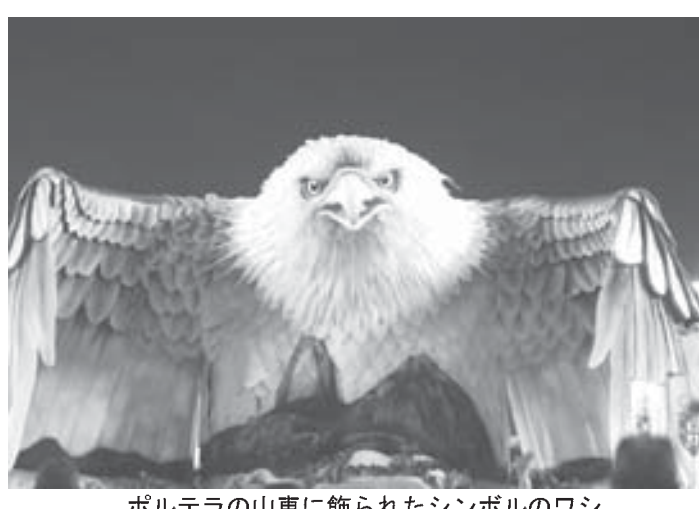
ボルテラの山車に飾られたシンボルのワシ

2、3日にリオ市サブカイのサンポドロモでパレードが行なわれたが、3〜5日付エスタード紙の批評は例年以上に厳しいものが目立っている。初日となった2日のパレードで高評価を受けたのはマンゲイラ、サルゲイロ、ベイジャ、フレイラ、イザベルを優勝に導いたカルナヴァレスコ、ロリザ、マカリヤンエスを迎え、12年ぶりの優勝