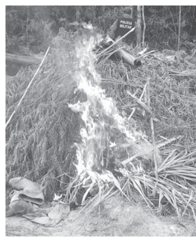
6万本のコカインを栽培する違法農園を警察がパラ州で見つけた。

コカイン使用者の急増は、伯国がポルビア、ペルー、コロンビアといったコカイン生産国に囲まれている事とも関連する。従来はこれらの国で製造されたコカインが欧米諸国に輸出される際の通過点に過ぎなかった伯国が、一大消費国になってしまった事も意味する。