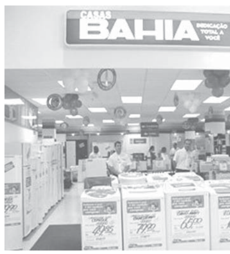
カーザス・バイアアの店舗の様子