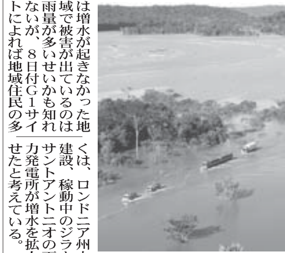
増水で大型車しか通れなくなっている国道364号線

【既報関連】北部を流れるマデイラ川などの増水が止まらず、ロンドニア州、アカレ州、アマゾン州、パラ州の被災者は2万2千世帯に及ぶと12日付付字紙が報じた。 ロンドニア州ポルト・ヴェーリョでは、マデイラ川の水位が18・60メートルに達した2月6日7日に非常事態宣言を出したが、増水はその後も続き、11日には史上最高の19・04メートルに達した。 アカレ州を陸路でつなぐ唯一のルートである国道364号線は冠水し、大型で重い車以外通行不能で、アカレ州が陸の孤島化。食料や燃料などの輸送は空路や水路によって行っているが、品不足や物価上昇も起きている。 1万3千世帯以上が避難しているアマゾン州では、マデイラ川流域の2地区だけで5万人の患者が発生する可能性があるという。また、ロンドニア州と