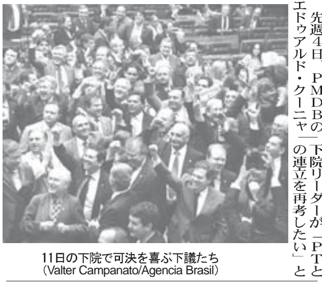
11日の下院で可決を喜び下議院議長たち

先週4日、PMDBの下院リーダーが「P.T.とエドゥアルド・クーニャの連立を再考したい」と発言してから、PMDBとP.T.の連立危機の状態が続いている。それは知事選出馬に伴う連邦政府の閣僚交代に際し、PMDBが5〜6人の大臣誕生を望んでいるのに、ジウマ大統領がそれに応じようとしていないためだ。