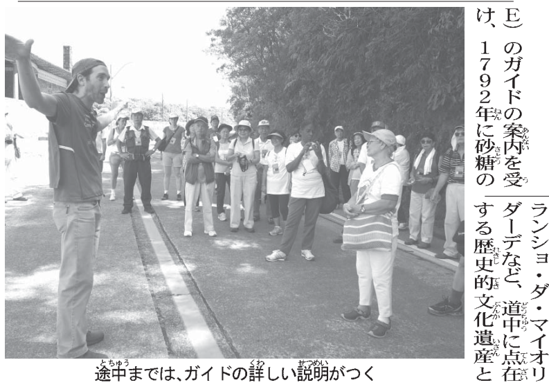
途中までは、ガイドの詳しい説明がつく

滞在中はイトゥー市でW杯中に日本代表がキャンプを行う宿舎施設なども見学予定。またコリンチャンスとの練習試合も組まれている。昨大会の模様などは同社サイト(www.futbolia.biz)から出展することを決めた。(ついで、深沢正雪記者)