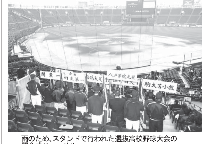
雨のため、スタンドで行われた選抜高校野球大会の開会式りハーサル

【共同】第86回選抜高校野球大会は21日に甲子園球場で開幕し、12日間、準々決勝翌日の休養日を含むの熱戦がスタートする。開会式は午前9時に始まる。20日の開会式りハーサルは雨の影響でグラウンドは水浸し、屋根のあるバツクネット裏で主将のみが行進した。本番と同じように、入