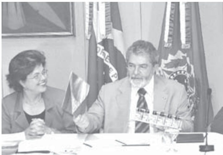
官房長官時代のジウマ氏(左)

20日付本紙でも報じたように、ペトロブラスは、ベルギーのアトラス社が2005年に4250万米ドルで手に取っていたパサデナ製油所を買収して、06年と09年に計1億8千万米ドルを支払ったこととなった。この問題については、国庫庁とリオ州検察局、連邦警察が不正取引の有無をめぐって調査中だが、その中で、06年に当時同社の経営者会議議長をつとめていたジウマ氏が買収を支持していたことが明らかとなった。