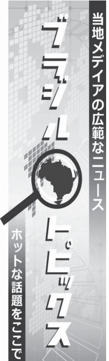
ブレイクポイント

応用経済調査院(IPEA)が13日に発表した「情報通信サービスに関する社会的受容性調査」によると、インターネット利用は年々拡大し、現在では40.8%の家庭がインターネットにアクセスする手段を持ち、68%の家庭では毎日ネットを利用しているという。同機関では3810世帯を対象に、固定電話や携帯電話、インターネット接続、有料テレビ、公衆無線LANに関するアンケートを実施した。 インターネット接続手段は、ケーブルテレビ32.8%、固定電話23.2%、携帯電話18.3%、衛星放送のプロッドバンド10.6%、ラジオオンのプロッドバンド10.2%、ダイヤル回線1.5%、その他3.6%となっている。家族の中で最低1人は携帯電話からインターネットに接続しているという家庭は38.1%に上る。 インターネットを利用しない家庭は、その理由を、コンピュータがない59.6%、インターネットサービス料が払えない14.1%、必要や関心がない4.7%、使い方を知らない4.3%と説明している。コンピュータを持っていない家庭は48.1%で、持っていない家庭に購入する意思があるかと問うたところ、29.3%は購入の意思はないと返答。34%は300〜800レアル位なら払えそうだと答えている。 インターネットサービスの利用料金は様々で、55.2%の家庭は310〜200レアル、20.2%は200〜100レアル、10.2%は100〜50レアル、1.5%は50レアル以下、1.5%は50レアル以上となっている。家族の中で最低1人は携帯電話からインターネットに接続しているという家庭は38.1%に上る。