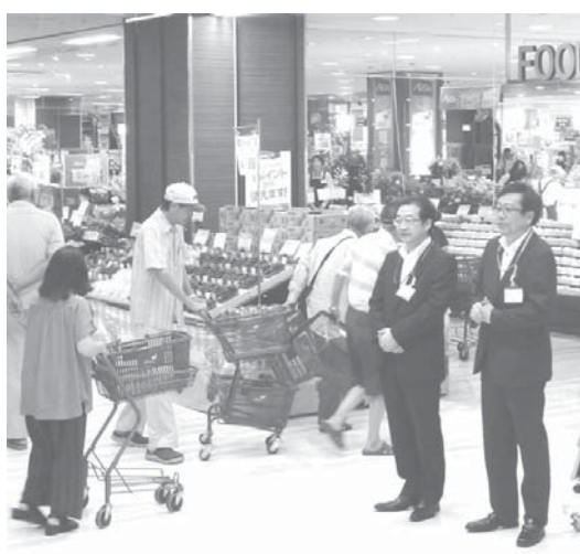
ダイエー新浦安店=千葉県浦安市

イオンは「増税前 今 加えた約2万8千店で大規模なセールを展開する」と銘打ち、24日まで全国の総合スーパー「イオン」は、衣料品や日用品などを通常価格より5〜10%安く売る。さらに、一部の地域を除いて電子マネー「WAON」(ウォン)のポイントが通常より増える対象品を設けた。