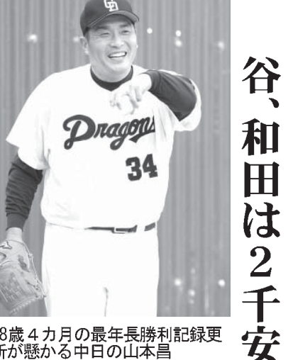
48歳4カ月の最年長勝利記録更新が懸かる中日の山本昌

【共同】開幕が近づいたプロ野球では今季も、48歳7カ月の中日の山本昌は浜崎真二(阪急)が1950年5月に中継ぎでつづけた48歳4カ月の最年長勝利記録更新が懸かる。通算218勝左腕は「意識はする。やればうれしいが、しんどい」と先はない。