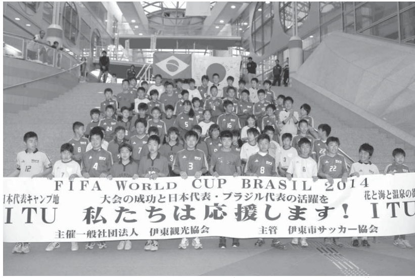
イトゥー市へメッセージを送る伊東市内のサッカーチームの子供たち

W杯日本代表の合宿地の聖州イトゥー市と発音が似ていることから、静岡県伊東市との間に姉妹都市交流へ向けた取り組みが始まった。両市の取り組みを深めるためのイベントや市長間の親書の交換も進んでおり、W杯を機に新しい日伯交流が進んでいる。