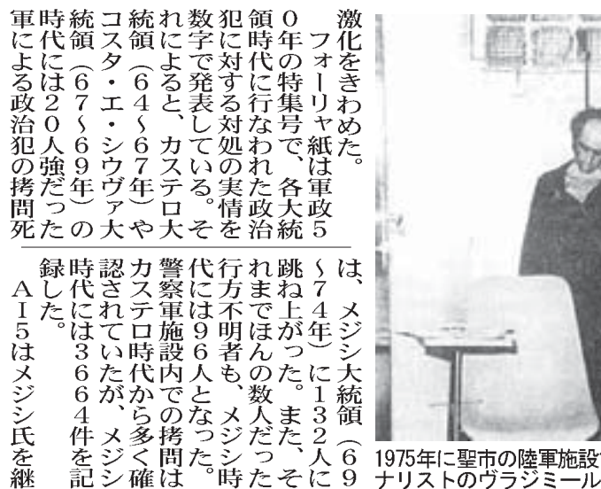
1975年に聖市の陸軍施設で拷問死したジャーナリストのウラジミール・エルゾーギ氏