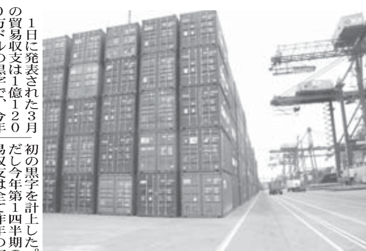
パラナグア港から輸出される穀物コンテナ