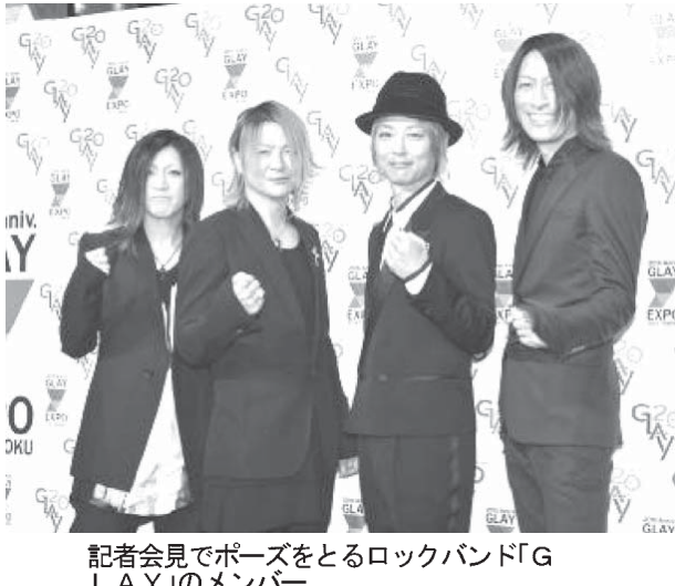
記者会見でポーズをとるロックバンド「GLAY」のメンバー

【共同】ロックバンド「GLAY」のメンバー4人が東京・六本木で記者会見し、「東北の皆さんを元気にしたい」という思いを込めて、9月20日に宮城県利府町の宮城スタジアムで5万人規模の大型ライブ「GLAY EXPO」を開くことを発表した。 ボーカルのTERUは、東日本大震災の被災者から「ライブで来てほしい」と言われてきたと明かし、「笑顔でみんなが楽しめる空間をつくりたい」と意気込みを語った。 今年デビュー20周年。リーダーのTERUは「GLAYは、僕らができることは音楽と共に東北に開かれ、今回は10年ぶりの現状を伝えること。2